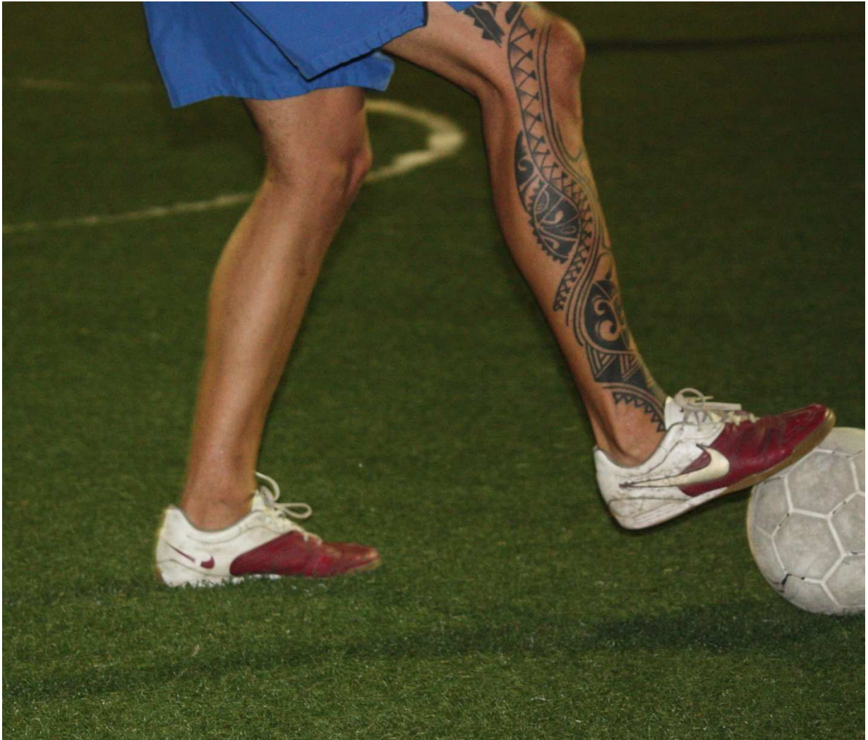
Figuur 1: Tatoeage op het been van een straatvoetballer 2.0

winnen, een alternatief te zijn voor de voetballers uit de middenklasse. In de discussie wordt hier dieper op ingegaan.