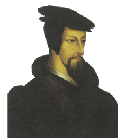
Fig 1. Johannes Calvijn (1509-1564).

Op basis van het Bijbelboek Genesis lijkt de zondeval al in een vroeg stadium van de mensheid plaats te hebben gevonden en de oorspronkelijke schepping van korte duur te zijn geweest. Wat zijn de gevolgen geweest van de zondeval op de mens? Heft de zonde de goede schepping totaal op of maar ten dele? 2 Dit zijn voorbeeldvragen die de auteur intrigeren. De auteur heeft een bijzondere interesse voor de eerste hoofdstukken van Genesis en theologische uitspraken over de natuur, omdat hij van 'van huis uit' bioloog is en de schepping zijn theologische interesse heeft. Naast de interesse voor het eerste gedeelte van de Bijbel, heeft hij, als gereformeerd theoloog, ook een grote belangstelling voor de reformatie en haar vertegenwoordigers, in het bijzonder voor de Frans-Zwitserse reformator Johannes Calvijn (1509-1564). Beide interesses komen samen in dit scriptieonderzoek, dat in het kader van de Masteropleiding Wortels en ontwikkeling van het Christendom zal worden uitgevoerd.