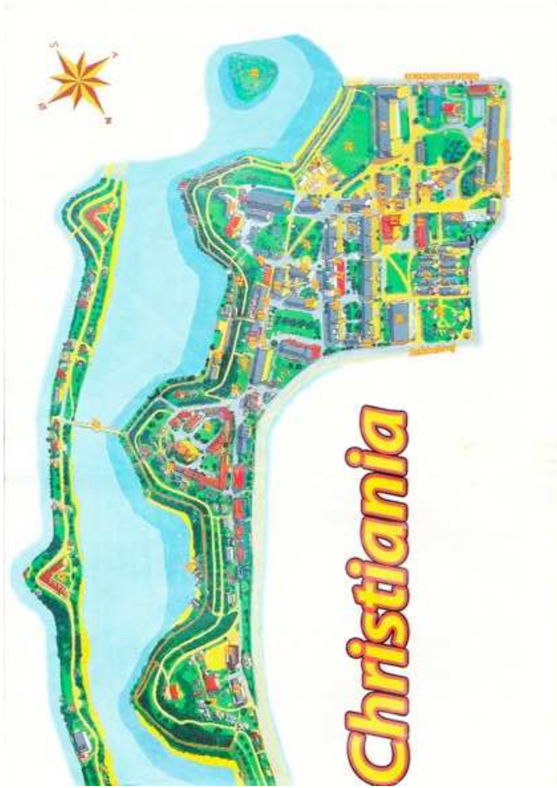
Afbeelding 0.3: Kaart Christiania deel 2 (Christiania Tour Guide 2006)