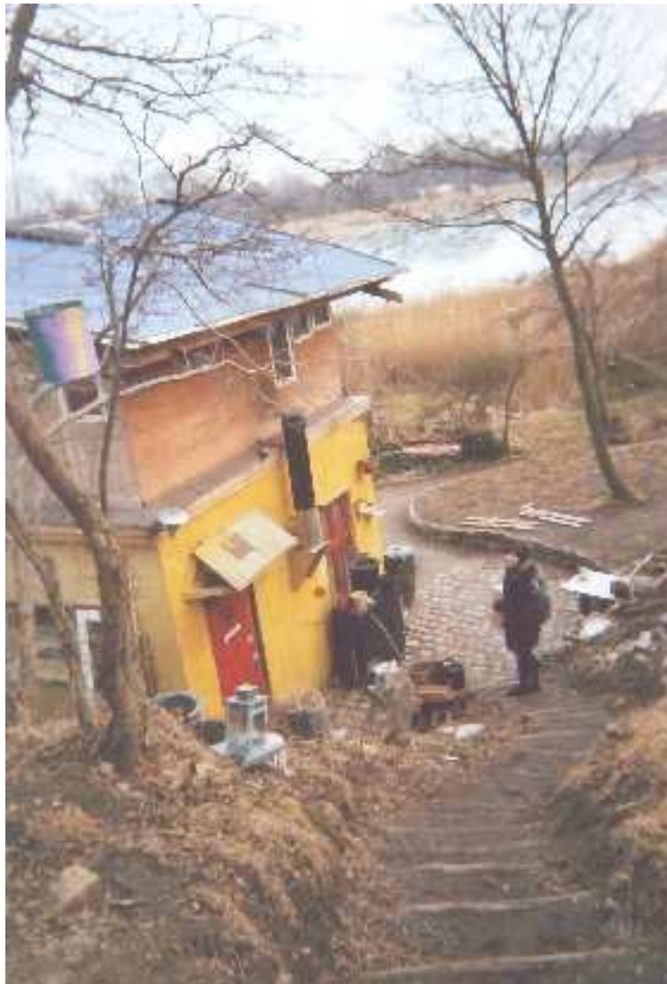
Afbeelding 7.1: Dit ben ik met brandhout bij Vadestedet

Tijdens je studie lees je over veldwerk doen en leer je dat je eerste veldwerk een soort initiatieritueel is. Niets bleek minder waar. Het doen van veldwerk is voor mij een directe confrontatie geweest met mezelf en mijn eigen culturele en morele grenzen. Ik heb me gerealiseerd, tijdens mijn veldwerk en vooral tijdens het schrijven mijn scriptie, dat je je nauwelijks kunt voorbereiden op zo'n ervaring.