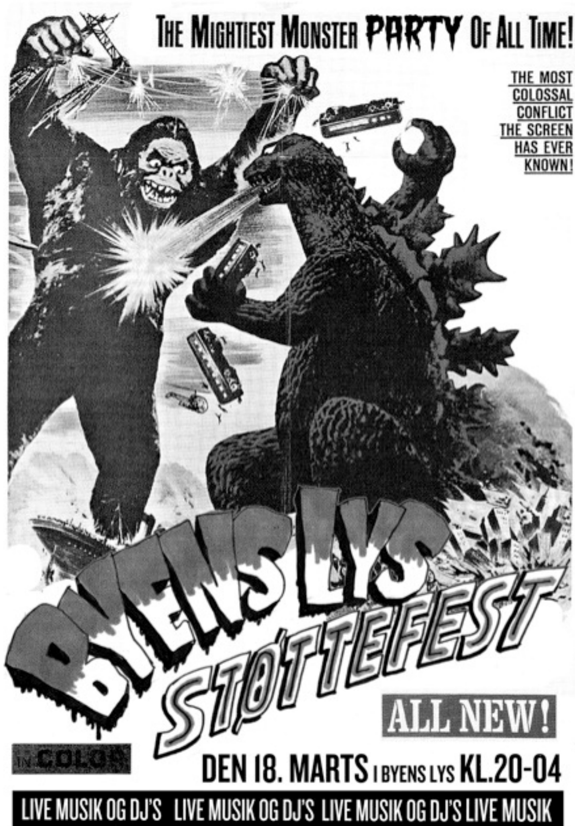
Afbeelding 5.1: Flyer voor het benefietfeest in Byens Lys