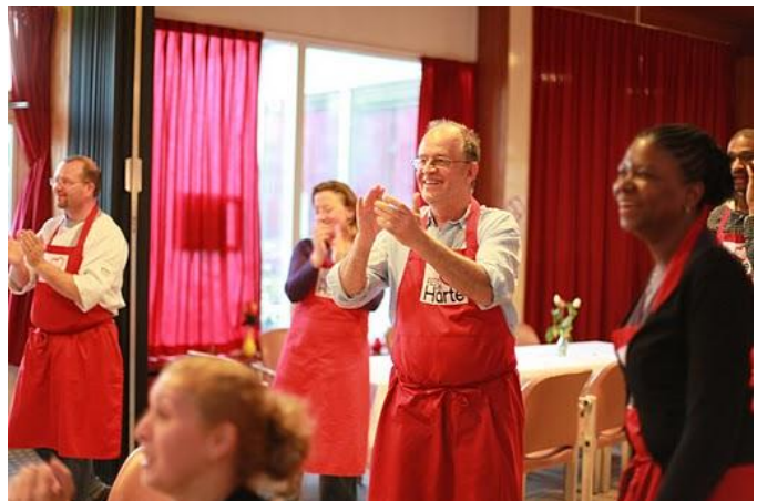
Meezingen en klappen met de muziek.

Komt de interactie tot stand door over de programmering te praten of maakt dat eigenlijk niets uit? Het lijkt erop dat het niets uitmaakt, mensen praten toch wel met elkaar. Maar wat is dan de functie van de programmering? Op 12 april, interview 3, zegt mevrouw A het volgende: “Ja, nou ja, niet om in contact te komen, maar het helpt om niet continue met elkaar bezig te zijn. Het is wel prettig dat er een afwisseling is. Je kunt dat soms ook even luisteren. [...] Je bent niet zo gefixeerd op elkaar.” 69 Deze mevrouw slaat de spijker op de kop. De programmering werkt als een bliksemafleider. De tafelgenoten zijn niet alleen met elkaar bezig, maar hebben de kans om af en toe ergens naar te kijken en samen van te genieten. Mevrouw A (26 april interview 2) stelde: “Dan kom je makkelijker los.” 70 Dat betekent niet vanzelfsprekend dat ze vervolgens met elkaar delen wat ze hebben gezien en ervaren, maar wel dat de sfeer ontspannen blijft en dat er ruimte komt om van gesprekonderwerp, -partner of zelfs van tafel te wisselen. De avond wordt ook langer met een programma: het is niet alleen snel even een hap naar binnen werken, het is een diner met aankleding: “Als je hier alleen komt eten, dan ben je na een half uur alweer naar huis. Het is die combinatie, de afwisseling. Dan heb je ook wat om met elkaar te praten.” 71