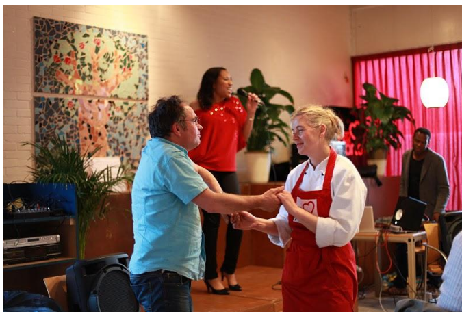
Er wordt nagedanst.

Op 12 april 2011 zijn er veertig gasten aanwezig, met een gemiddelde leeftijd van ongeveer veertig jaar. Er zijn zeventien mensen aanwezig van een woningcorporatie uit Tilburg, de rest van de gasten is alleen gekomen, maar sommige kennen elkaar van eerdere avonden. Het cultureel/kunstzinnige programma wordt verzorgd door een donkere zangeres, die pop, soul en jazznummers zingt, tussen de gangen door. Ik heb in totaal tien mensen geïnterviewd; interview 1 is met 2 mannen (meneer A en B: meneer B is culturele univoor), interview 2 is met één man en drie