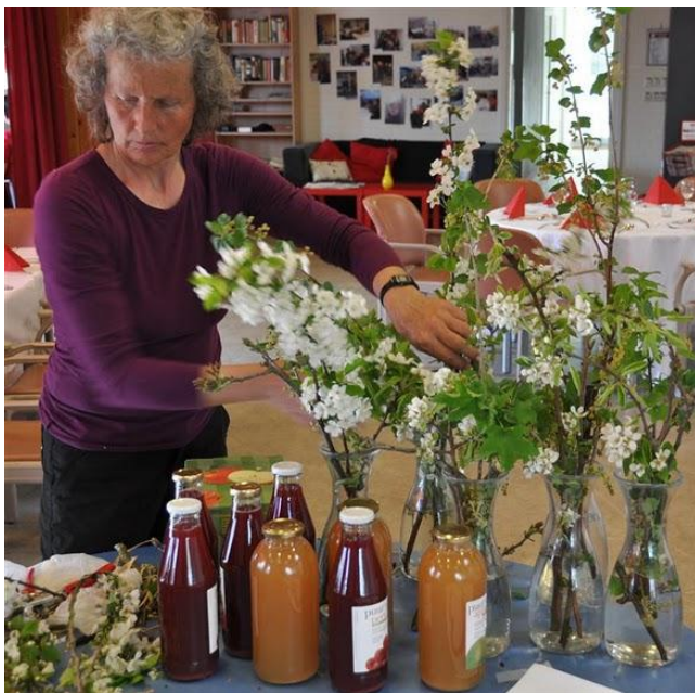
We vieren de lente!

De cultureel/kunstzinnige avonden worden beter bezocht dan de maatschappelijk/sociale avonden. Heeft dit te maken met het thema van de avond of is er een andere reden voor? Bij drie van de vier avonden wist niemand dat er een programmering zou zijn; het thema heeft dus geen invloed. Maar waar komen dan de extra gasten vandaan? Over het algemeen komen de extra gasten mee met de programmering: de zangeres en het STUTkoor hebben hun eigen publiek mee gebracht. Bovendien heeft STUT zelf extra reclame gemaakt voor de programmering van 26 april. Het bereik van Resto wordt hiermee vergroot, maar de buurtbewoner wordt niet aangesproken. De Resto VanHarte in Kanaleneiland maakt nauwelijks actief reclame voor haar programmering. Een enkele