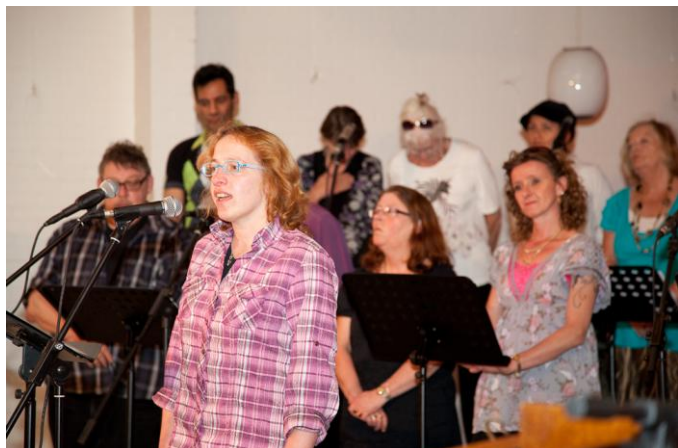
Het STUT koor.

Mevrouw A, interview 2, zegt: "Vooral dat laatste, dat lied, hoe heette dat ook alweer? 'Een glimlach van een kind'. Dat vind ik een mooi lied. En ik heb zelf ook