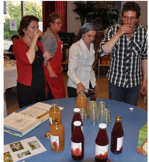
Samen sap proeven.

Kunst oefent invloed uit op mensen, maar deze invloed is moeilijk los te koppelen van andere sociale invloeden. Tijdens de avonden bij Resto VanHarte wordt er een sfeer gecreëerd die uitnodigt tot gesprek, tot interactie en, indirect, tot verbondenheid en sociale cohesie. En kunst leveren zeker een bijdrage aan het creëren van de juiste sfeer. In het volgende hoofdstuk, de conclusie, wordt deze bijdrage uitgebreider besproken.