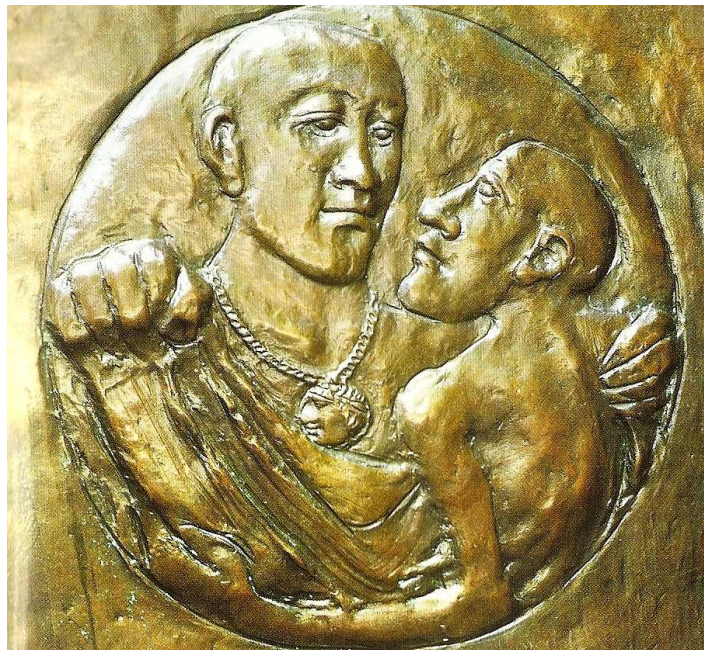
Afbeelding 4 | Martinus en de bedelaar (1996). Een eigentijdse uitbeelding van de mantelscène in één van de bronzen deuren van de Domkerk te Utrecht.

In een glas-en-lood raam in de voormalige Sint Martinuskerk, zien we Martinus als bisschop afgebeeld, met zijn bisschopsmijter en –staf en een spreekbaar makend. De afbeelding zelf is niet zo zeer herkenbaar als de heilige maar het