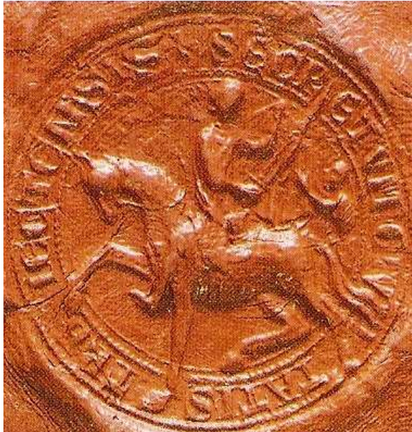
Afbeelding 2 | Achterzijde van een stadszegel (1310-1454) waarop Martinus en zijn mantelscène zijn afgebeeld.

Beeltenissen van Martinus bleven echter niet beperkt tot louter religieuze aspecten van het middeleeuwse Utrecht. Een zeer sprekende en overtuigende illustratie daarvan is dat het stadsbestuur een groot polychroom beeld van Martinus op de gevel van het Utrechtse Schepenhuis liet plaatsen. Vermoedelijk overtrof het beeld de overige vierentwintig in omvang en indruk. Ook de grote