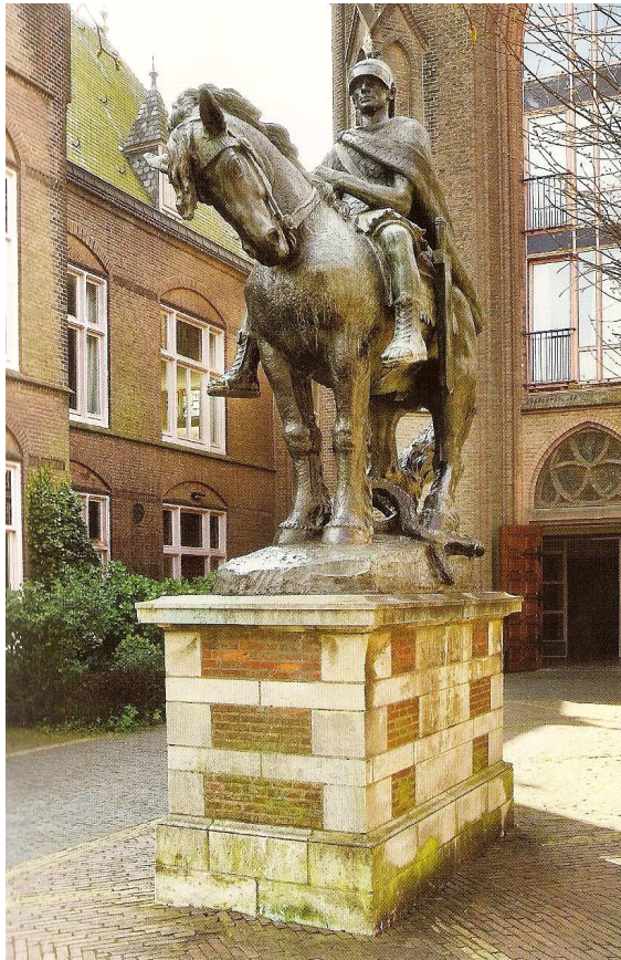
Afbeelding 5 | Beeld van Martinus voor de voormalige Sint Martinuskerk te Utrecht. Martinus verslaat hier de draak van het kwaad.

sneed, waardoor zijn witte onderkleed zichtbaar werd. In dat opzicht is de Utrechtse vlag ook één van de vele mantelscènes die de stad in de loop van vele eeuwen heeft gesierd.