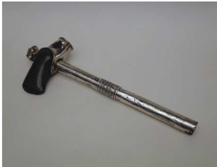
Afbeelding 1 | De Hamer van Martinus (ca. 1300) waarmee de heilige de duivel zou hebben doorkliefd (inv. nr. OKM M 38).

Uiteraard bevond zich in de kathedraal een Martinusaltaar waarin een aantal relieken van de heilige bewaard werden. 36 Het bisdom was in het bezit van een aantal primaire relieken, te weten een wervel uit zijn ruggengraat, een stukje schedel en een vingerkootje. Daarnaast bezat het enkele secundaire relieken, waaronder resten van zijn kledij, een brokstuk van zijn graf, een stukje pateen dat hem toebehoorde en een hamer waarmee hij de duivel zou hebben doorkliefd. 37 Verder is bekend dat het Martinusaltaar bij speciale gelegenheden met vaandels werd versierd – het is waarschijnlijk dat die vaandels ook met een beeltenis van Martinus waren gesierd – en dat het altaar in ieder geval een relatief groot, verguld beeld van de heilige omvatte. 38