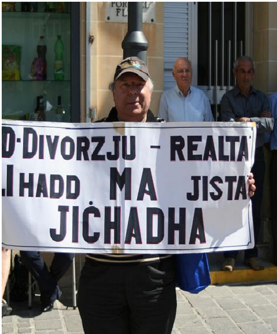
Figuur 1 Scheiding is een werkelijkheid die niemand kan negeren