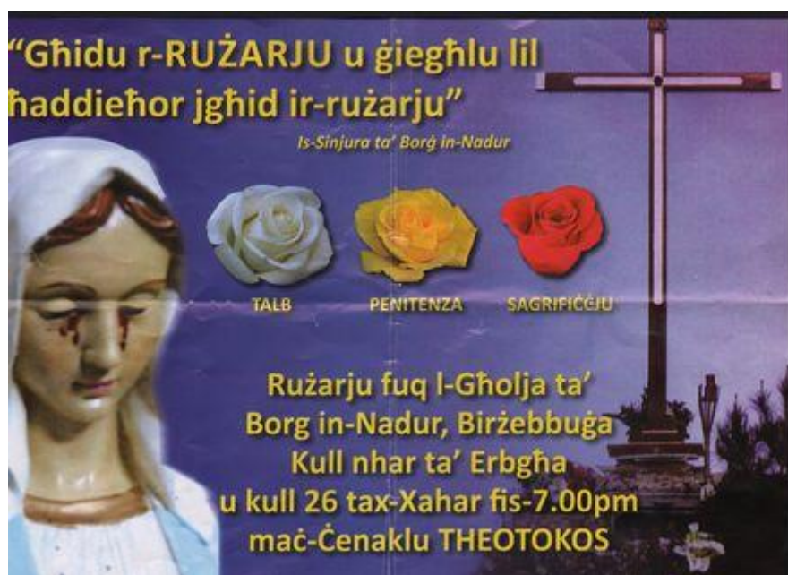
Figuur 6 Flyer met de huilende maagd Maria

Bijlage 5: Flyer die uitgedeeld werd op de dag van het referendum