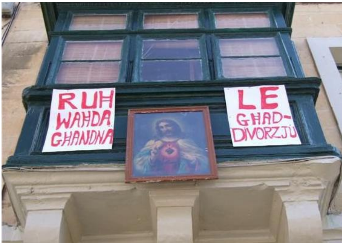
Figuur 2 We hebben maar een ziel, zeg nee tegen scheiding

Parodieën en spot moest de toon luchtig houden, maar vaak liepen de emoties hoog op. Zo ook bij hen die voor de introductie van scheiding waren.