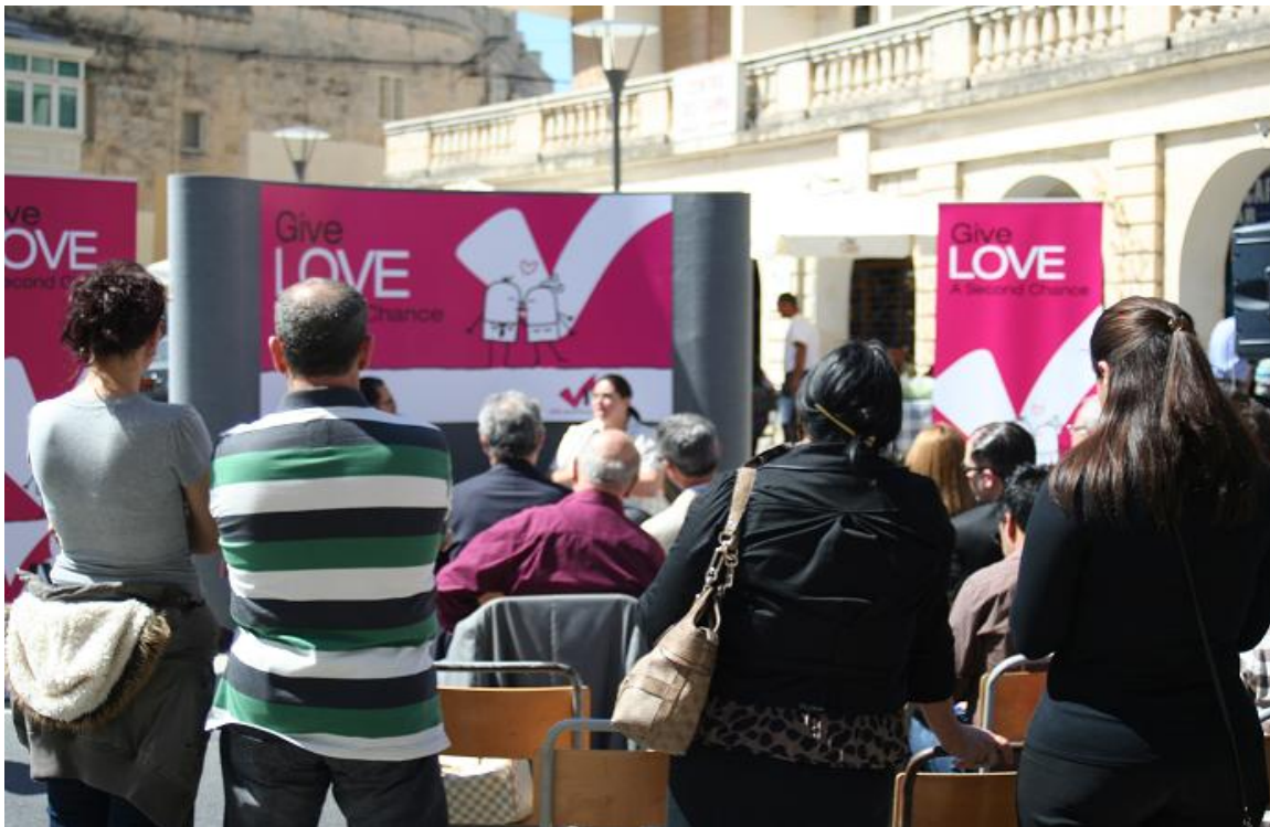
Figuur 3 De IVA beweging voert campagne in Rabat

De uitslag van het referendum betekent nog niet dat scheiding ook daadwerkelijk geïntroduceerd zal worden. Het was namelijk slechts een consultatief referendum en het parlement is sterk verdeeld. Zo hebben een aantal parlementsleden al gezegd om alsnog tegen de introductie te zullen stemmen, omdat het niet overeenkomt met wat zij goed achten voor de samenleving. Ondanks felle kritiek van andere politieke partijen blijft het de vraag of de uitslag van het referendum gehonoreerd zal worden en Malta daadwerkelijk echtscheidingswetgeving zal kennen.