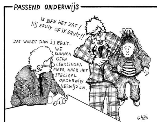
Afbeelding 2: de zorgplicht doet zijn intrede

Komt het passend onderwijs tegemoet aan de knelpunten die ervaren worden in de praktijk? Passend onderwijs betekent aan de ene kant dat er minder geld beschikbaar is maar efficiënter en effectiever wordt ingezet door de specialisatie. Anderzijds betekent dit dat de huidige zorgstructuren in de school waarschijnlijk niet meer behouden kunnen worden, omdat de financiering van deze structuur neerkomt op minder geld dat verdeeld moet worden onder meer belanghebbenden. Scholen moeten dus opnieuw gaan zoeken naar een goede manier van zorg voor rugzakleerlingen en andere zorgleerlingen. Tegelijkertijd moeten ze door de zorgplicht wel dezelfde zorg blijven bieden. De zorgplicht op zich is een goed initiatief en wordt op veel scholen al nagestreefd. Waar passend onderwijs aan tegemoet komt is de bureaucratische rompslomp. In de toekomst wordt dit vereenvoudigd en moet de aanvraag voor lgf sneller gaan. Hierbij speelt het nieuwe beleid in op de knelpunten in de praktijk.