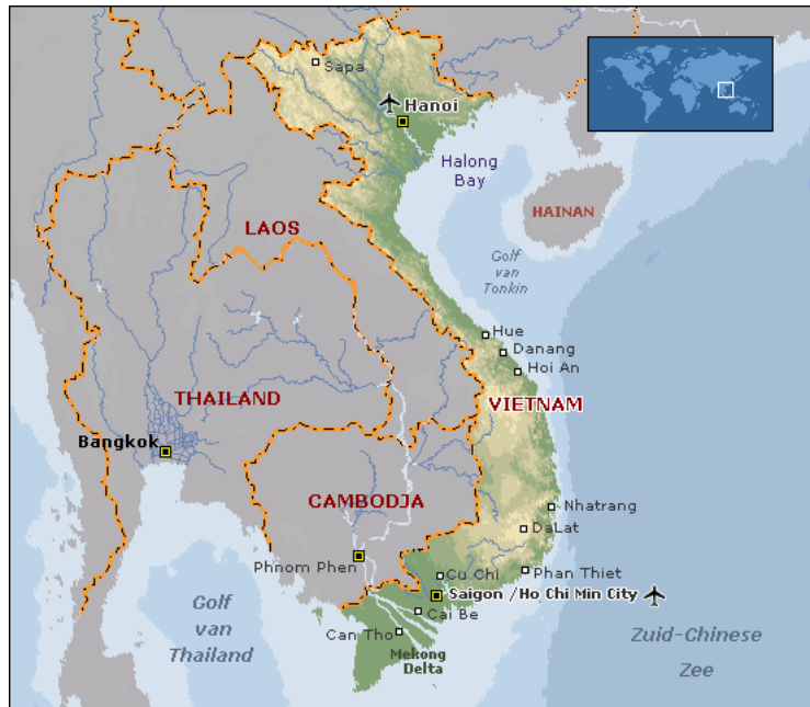
Figuur 3: kaart Vietnam

langs de Zuid-Chinese Zee loopt. Vietnam is te verdelen in Noord-Vietnam, Centraal-Vietnam en Zuid-Vietnam. Noord-Vietnam wordt gekenmerkt door een kleine delta en een groot bergachtig gebied. Centraal-Vietnam wordt gekenmerkt door een smalle strook tussen de Truong Son bergketens en de zee. Zuid-Vietnam wordt gekenmerkt door een ononderbroken vlakte en door één van de grootste rivieren van Azië, de Mekong. De belangrijkste steden in Vietnam zijn de hoofdstad Hanoi, Ho Chi Minhstad (voorheen Saigon), Hue, Da Nan en Can Tho (Xuan Tu 1991:260-261).