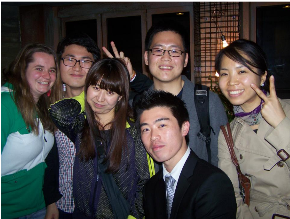
Veldwerkfoto: Ik met informanten veldwerk

Ondanks de tegenslagen aan het begin van mijn veldwerk kijk ik met ontzettend veel plezier terug op mijn veldwerk. Het was ontzettend leerzaam maar vooral fascinerend. Waar ik met het meeste plezier op terugkijk is wel dat je elke dag weer zoveel nieuwe dingen leert die zo interessant zijn voor je onderzoek. Het vele leren helpt je ook om bij eventuele tegenslagen gemotiveerd te blijven. Zelf merkte ik dat je door alle data die je verzamelt, je door je onderzoekerrol meteen heel analytisch gaat denken over alles. Dit leidde vaak tot leuke momenten waarop verschillende data opeens samenvallen en ik heel enthousiast werd over wat ik had gevonden. Dit gold niet alleen voor data die ik verzamelde voor mijn onderzoeksvraag maar ook voor data die hier juist niets mee te maken hadden. Doordat je zo in die onderzoekerrol zit vallen dat soort dingen je meer op en denk je bij veel dingen; “Wow, dit zou zo interessant zijn om te onderzoeken.” Het was geweldig om meer te leren over de Koreaanse cultuur en de samenleving en het heeft me zeker aan het denken gezet voor volgende onderzoeken.