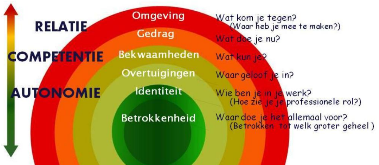
Ui-model met de drie psychologische basisbehoeften (Korthagen & Vasalos, 2007)