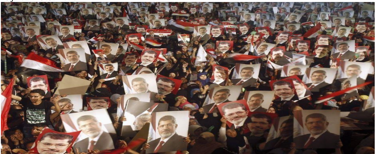
Leden van de Moslimbroederschap en aanhangers van de afgezette president Mohamed Morsi op het Raba El-Adwyiaplein in Caïro, 28 juni 2013 Egypte.