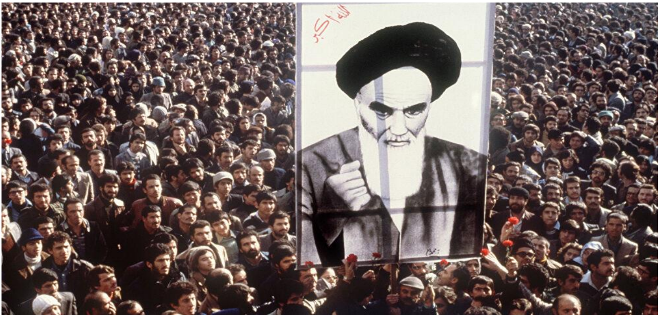
Iraniërs in Teheran dragen een poster van Ayatollah Khomeini, tijdens een demonstratie tegen de sjah, 16 januari 1979.

Waarom Khomeini na de revolutie in Iran de macht definitief wist te grijpen en de Moslimbroederschap onder Morsi hier niet in slaagde na de Egyptische revolutie