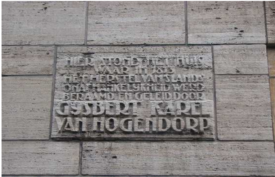
Afbeelding 3. De gedenkplaat op het huidige huis aan de Kneuterdijk 8

Bijna aan het eind van de biografie staat dat