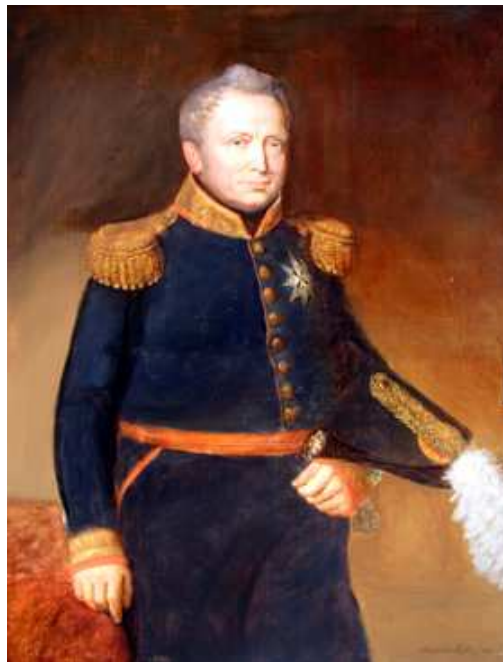
Afbeelding 2. Koning Willem I

Willem Frederik, de oudste zoon van stadhouder Willem V en Wilhelmina van Pruisen, werd in 1772 geboren in den Haag. Hij studeerde in Leiden van 1789-1790 staatswetenschap en privaatrecht en volgde ook colleges natuurkunde. 54 Zijn afstudeerscriptie ‘over den besten regeringsvorm aan de Belgische provinciën’ pleitte voor een federatie met de Noordelijke Nederlanden onder bewind van de Raad van State en de stadhouder. Zijn docenten vonden Willem Frederik leergierig en ambitieus, maar ook eigenwijs en gesloten en stroef in de omgang. 55