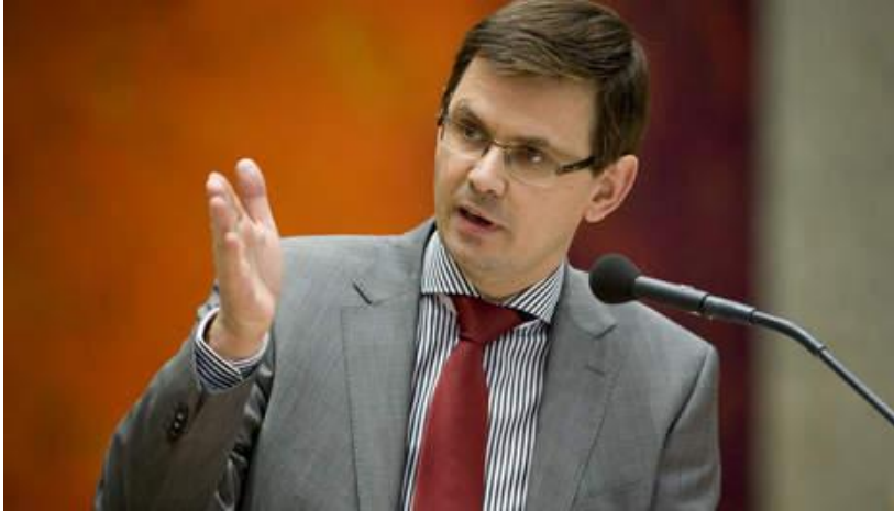
Andere Routvoet: Naast het CDA is voor de CU gemeenschapszin een belangrijk onderwerp.

In de discussies over gemeenschapszin gaat het over de sociale samenhang in het publiek domein en een gedeeld waardebesef. Onderwerpen die worden besproken zijn de maatschappelijke verbanden tussen burgers en het toenemende gevoel van verminderde binding met de gemeenschap. Men vindt het met zichzelf goed gaan, maar met de gemeenschap slecht gaan. Het is vooral het CDA en relatief gezien ook de CU die de term gemeenschapszin vaak gebruiken. Men heeft het over vrijwilligerswerk en een dag van de maatschappelijke binding om meer gemeenschapszin te stimuleren.