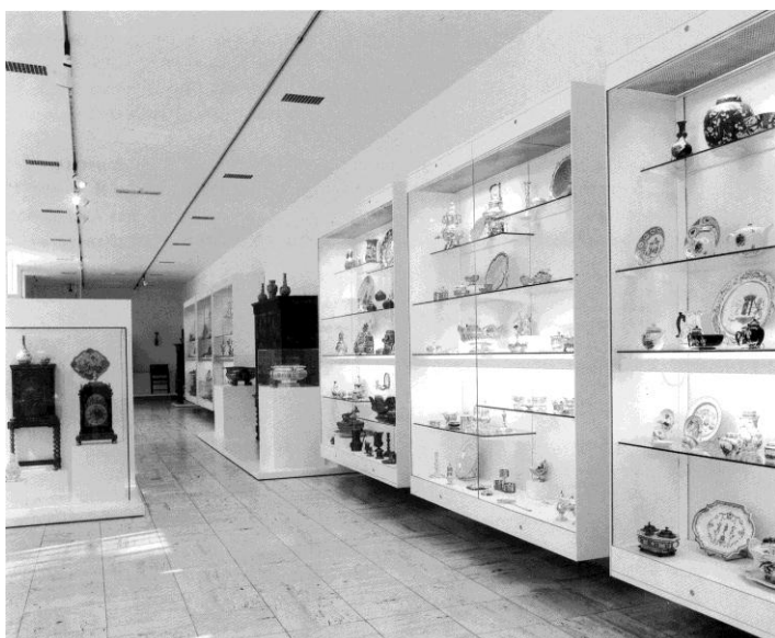
afb. 3. Kunstnijverheid uit de achttiende eeuw in de nieuwe chronologische opstelling in wandvitrines, ca. 1992. De verschillende materialen staan bij elkaar.