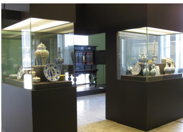
afb. 5. 17 e eeuwse Delfts en Chinees aardewerk en porselein. De Collectie Twee, zaal 44.