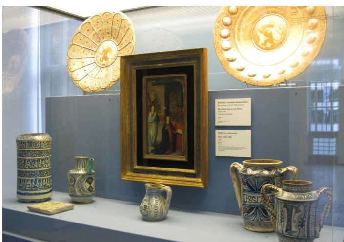
afb. 6. 15 e en 16 e eeuwse Spaans, Italiaans en Nederlands majolica. De Collectie Twee, zaal 41.