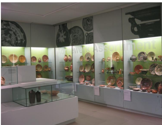
afb. 10. Gebruikskeramiek 12 e -19 e eeuw. Detailinformatie is te vinden op de geplastificeerde A4-pagina's. De Studiecollectie Eén, 2010.