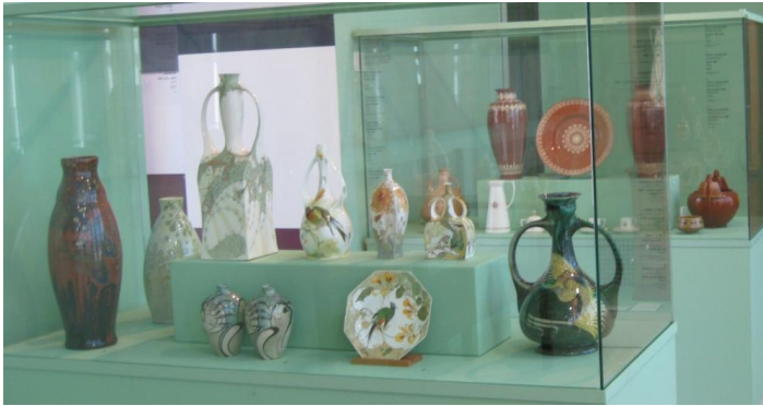
afb. 7. Begin 20 e eeuw Nederlands Art Nouveau en Art Deco porselein en plateel. De Collectie Twee, zaal 47.