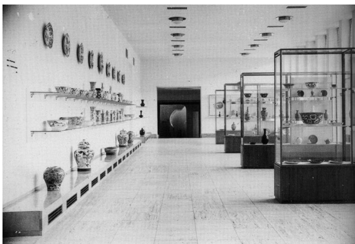
afb. 2. Opstelling porselein en aardewerk in transparante vitrines en 'open en bloot' langs en aan de wand, zaal 41, 1935.