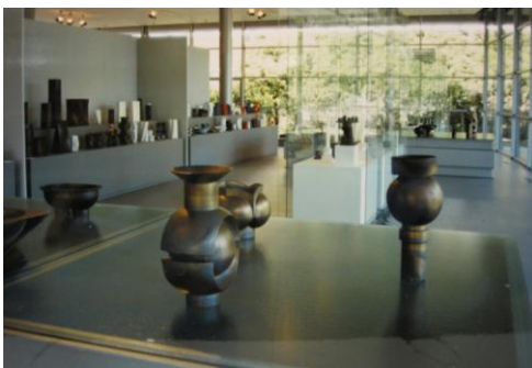
afb. 9. Tentoonstelling Jan van der Vaart - 35 jaar . Monochrome en geometrische handgedraaide unica en (gegoten) seriematig keramiek. Paviljoen, 1991