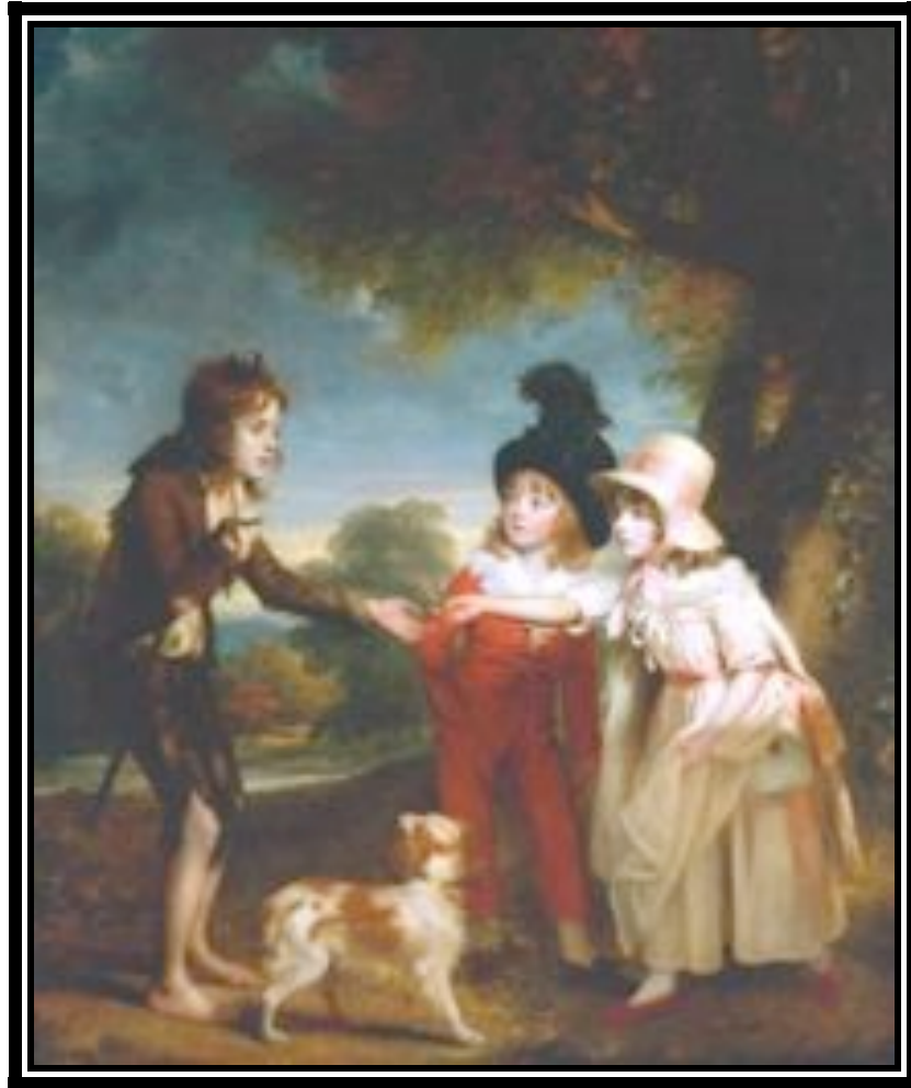
Beechey's Portrait of Sir Francis ... 299

In 1793 verscheen Sir Willieam Beechey's Portrait of Sir Francis Ford's Children Giving a Coin to a Beggar Boy , waarop twee kinderen uit een welgesteld milieu zijn afgebeeld die een aalmoes geven aan een arme jongeman. Aan de vooravond van de negentiende eeuw toont het de grote klassenverschillen en de zorgplicht die (een deel van) de rijke klasse kennelijk voelde voor de paupers. Het iets waar ze zich op lieten voorstaan, gezien het feit dat de kinderen uit deze klasse werden vereeuwigd tijdens het doen van een goede daad. Was het geven van aalmoezen volgens Tocqueville goed voor het in stand houden van sociale verbanden, zo zag Johan Rudolf Thorbecke (1798 – 1872) het als een naïviteit. Het toonde een gebrek aan