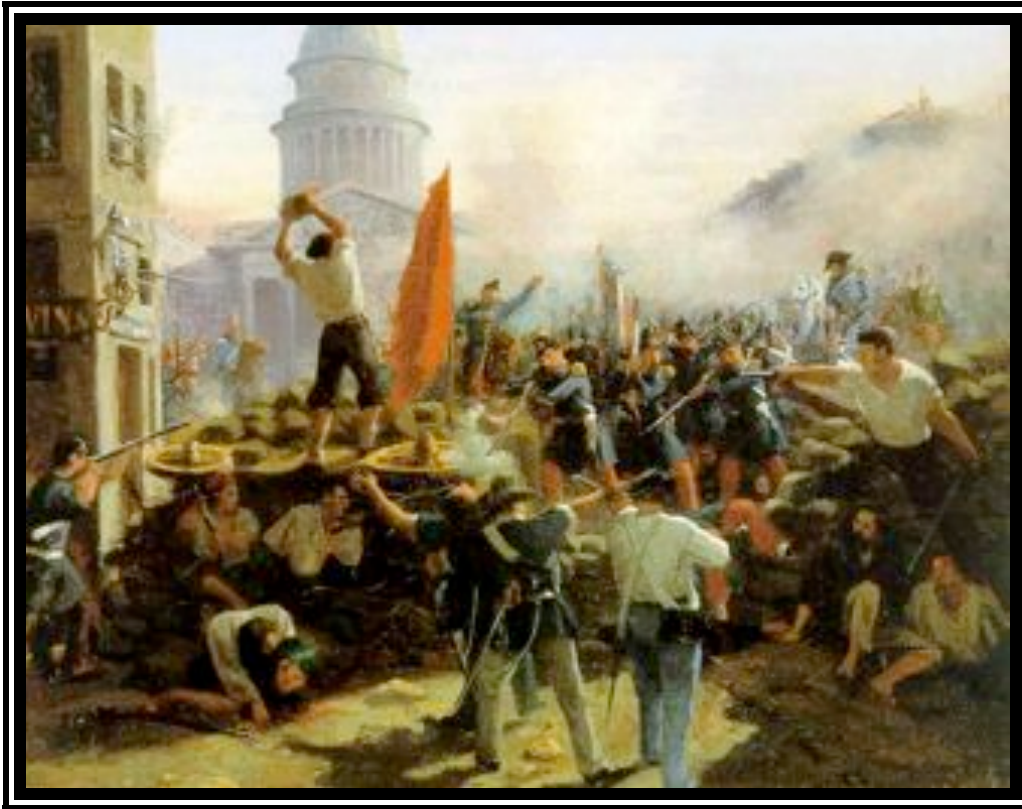
Vernet's Barricade rue Soufflot 379

De negentiende-eeuwse schilder Horace Vernet vereeuwigde de barricaden aan de Rue Soufflot in Parijs in het revolutiejaar 1848. Op de achtergrond is het Pantheon te zien, de laatste rustplaats voor de Franse intellectuele elite. Nog geen driehonderd meter er vandaan staat sinds de dertiende eeuw het indrukwekkende gebouw van de l'Université Sorbonne , de Universiteit van Parijs. In het revolutiejaar 1848 was dit de leefomgeving van de Franse anarchist Pierre-Joseph Proudhon (1809 – 1865). Opgegroeid in een eenvoudig en arm gezin is hij de enige denker in deze studie die aan den lijven heeft ondervonden wat armoede is. 380 Dit onrecht, dat hij later overal om zich heen zag in de ongelijkheid van de samenleving, heeft hem altijd bezig gehouden. 381 Hoe kon hij de samenleving rechtvaardiger maken en het leven van de armen draaglijker?