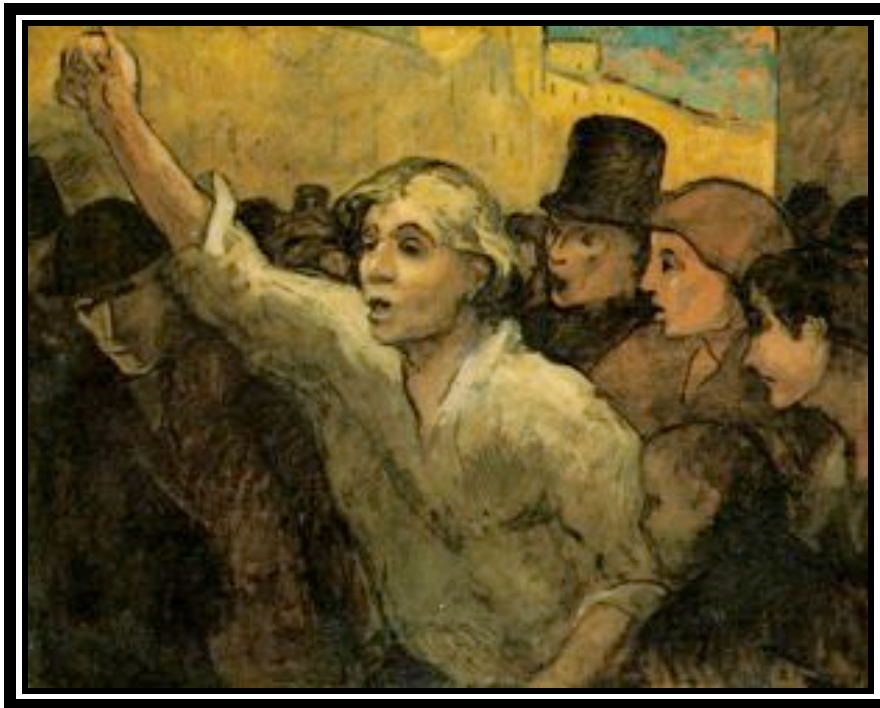
Daumier's Le Soulèvement 24

Honoré Daumier's Le Soulèvement uit 1860 toont een massa in een staat van onvrede. De grauwe kleren en ingevallen wangen laten zien dat het hier om een groep stedelingen uit de lagere klasse gaat. Het schilderij illustreert de ontvlambaarheid van deze onderklasse in de negentiende eeuw. De slechte leefomstandigheden zorgden voor een constante dreiging van opstand en deze gespannen verhouding in de samenleving vond haar uitwerking in de literatuur, de poëzie, en de kunst. In romans als Oliver Twist (1838) en Hard Times (1854) beschreef Charles Dickens het dagelijks leven van de armen dat zich afspeelde in de marges tussen sloppenwijk en fabriek. Victor Hugo maakte naam met de filosofisch roman Les Misérables (1862), waarin hij de misstanden van de Europese steden aankaartte.