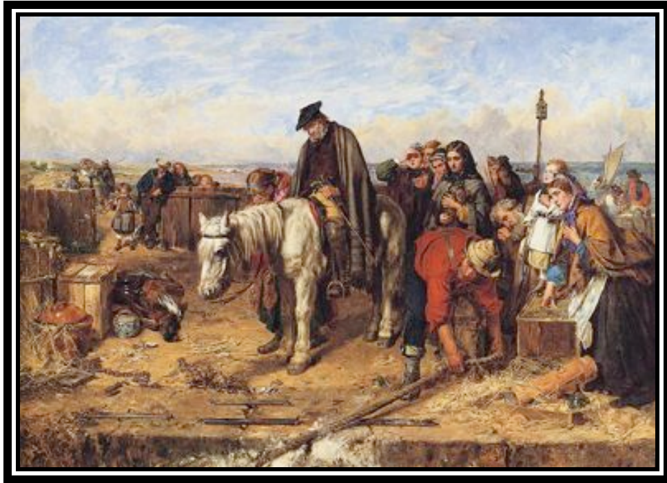
Faed's The last of the clan 214

Thomas Faed's The last of the clan (1865) illustreert een Schotse man die zich genoodzaakt ziet zijn dorp te verlaten. Via emigratie hoopt hij elders een beter bestaan op te bouwen. Emigratie was een veelgehoorde maatregel in het debat over pauperisme in de negentiende eeuw, zo ook in de werken van John Stuart Mill (1806 – 1873). De paradox dat in een welvarende maatschappij onevenredig veel mensen tot de armenzorg waren veroordeeld was voor Mill een fundamenteel probleem. 215 Mill zou zich dan ook uitvoerig met het thema bezig houden. In zijn Principles of political economy (1848) 216 wijdt hij grote delen aan ongelijkheid, maar ook uit andere geschriften blijkt dat hij het armoedevraagstuk van belang vond. 217 Mill wilde een zo rationeel en empirisch mogelijk antwoord formuleren op de vraag hoe men de volkse massa's zelfdiscipline bij kon brengen. 218 219