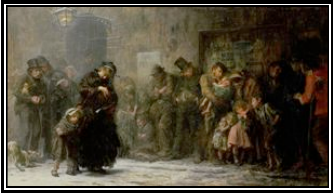
Fildes' Applicants for Admission ... 142

Sir Samuel Luke Fildes' Applicants for Admission to a Casual Ward (1874) toont een groep armlastigen die wachten bij het loket waar hun publieke bijstand verstrekt wordt. De kleine uitkering zal er voor gezorgd hebben dat de armen hun huur konden betalen en hun inkopen weer konden doen. Maar soms is de weg naar de hel geplaveid met goede bedoelingen. Een gedachte van die strekking moet Alexis de Tocqueville (1805 – 1859) hebben bezig gehouden toen hij in 1833 een reis door Engeland maakte. 143 Ondanks de ongekende welvaart die Engeland in de negentiende eeuw vergaard had, had de Engelsman een veel grotere kans in armoede te eindigen dan inwoners van minder bedeelde landen als Portugal en Spanje. 144 En dat terwijl Engeland sinds de invoering van de eerste armoedewetgeving, de Poor Relief Act van 1598, altijd voorop had gelopen met wettelijke bijstandsvoorzieningen voor minder bedeelde. 145 Hoe kon het dan dat een zesde deel van het volk in armoede leefde? 146