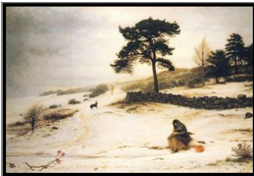
Millais' Blow, blow, thou winter wind 477

John Everett Millais' Blow, blow, thou winter wind uit 1892 toont een volkse vrouw in een verlaten landschap. In veel van Millais' werken worden arbeiders in erbarmelijke omstandigheden uitgebeeld. Zijn schilderkunst illustreert dat het probleem van het pauperisme behalve in de filosofie ook in de kunst leefde. In de voorgaande hoofdstukken is uiteengezet hoe vier politiek denkers uit de negentiende eeuw het spanningsveld tussen pauperisme, burgerschap en democratie een plaats probeerden te geven in hun filosofie en welke invloed dit had op hun begrip van de civil society en hun positie binnen de liberale ideologie. In dit hoofdstuk worden Tocqueville, Mill, Thorbecke en Proudhon vergeleken op basis van hun begrip van de civil society en hun positie binnen het liberalisme in combinatie met het probleem van het pauperisme.