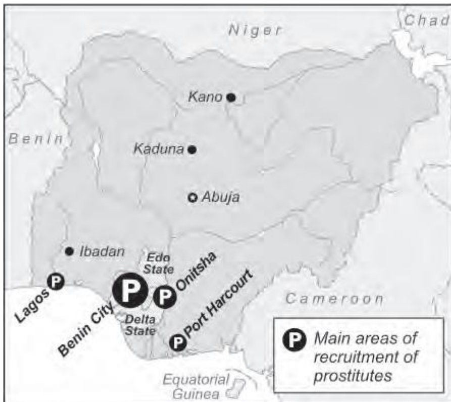
Main areas of recruitment of prostitutes in Nigeria for emigration to Europe. 53

In deze alinea zal worden belicht hoe de armoede in Edo State invloed heeft gehad op de vrouwenhandel. Tot begin jaren negentig maakte Edo deel uit van een veel grotere deelstaat Bendel State, met als hoofdstad Benin City. De hoofdstad vervulde altijd een centrale rol in het zuidwesten van Nigeria en had veel overheidsinstanties. De SAP-maatregelen zorgden voor grote werkloosheid. Door de opdeling van Bendel State raakte Benin City een deel van haar centrale functie kwijt. De stad werd de hoofdstad van een veel kleiner gebied, namelijk Edo, en sommige overheidsdiensten werden daarom ingekrompen of verdwenen helemaal. Ook andere bronnen van inkomsten verdwenen. De houtindustrie, die in dit gebied altijd een belangrijke rol speelde, werd geconfronteerd met overbepakking en dus dalende inkomsten en