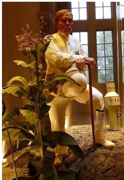
De pop van Jacob Theodor Cremer in het Tropenmuseum.

Hij is een potentiaat. Verbiedt per decreet alles wat hem niet zint. Zijn goede relaties in de Den Haag zorgen ervoor dat hij dit ook kan doen. Hij heeft, vooral in zijn begintijd, grote moeite met het vinden van geschikt personeel. Afgestudeerde ingenieurs in Holland zijn lui en ambiëren de zekerheid van een ambtenarenbestaan. Hij verzet zich hevig tegen het afschaffen van de poenale sanctie. 58 Deze sanctie bepaalde dat een planter zijn koelies onbeperkt strenge straffen mocht opleggen die hij zelf geschikt vond, inclusief boetes. De planter was nu politie en rechter. In 1910 was hij mede-oprichter van het Koloniaal Instituut. (De voorganger van het KIT) Deze keuze laat duidelijk zien dat het KIT zich bewust is van zijn eigen geschiedenis en dat ook duidelijk naar voren brengt in de tentoonstelling.