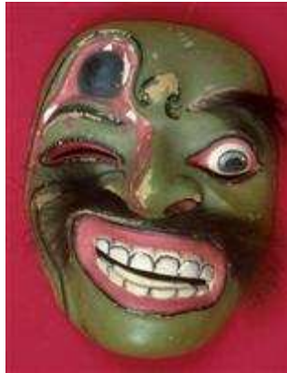
'ziekt masker' met een duivelse grimas

Het beeldmerk van 'Oostwaarts!' is het 'ziekt masker' met een duivelse grimas uit het Javaanse theater. Het masker speelt de rol van nar: de grappenmaker die dingen zegt die anderen nooit zouden durven. 62 Dit sluit goed aan bij de rol die het KIT speelt als eerste volkenkundig museum dat zijn eigen geschiedenis opzoekt en gebruikt.