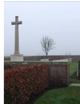
Afbeelding 2: Cross of Sacrifice van Suffolk cemetery, Kemmel

Het idee achter de steen kwam dus, zoals eerder beschreven, van Lutyens. Hij kreeg het idee voor de steen in 1917 nadat hij met Kenyon en Baker de tijdelijke begraafplaatsen bezocht had. Het abstracte idee van een altaar was snel geboren, evenals de afmetingen die het ongeveer zou moeten hebben en het idee dat er een zingevende tekst op moest komen te staan. Toen stond hij voor het dilemma van het geven van een naam aan zijn object. Hij had circa 40 verschillende mogelijkheden uitgedacht. 71 Daarnaast moest er dus een geschikte tekst gevonden worden. Hierbij werd de hulp ingeroepen van de tekstschrijver van de IWGC, Kipling. Deze stelde voor om een passage uit het apocriefe Bijbel boek Sirach (44-14) te kiezen: ‘Their bodies lie buried in peace but their names liveth for evermore’. Lutyens schreef zijn vrouw dat hij bang was dat er een ‘s’ achter peace gelezen zou worden en dat men dan ‘pieces’ zou lezen. 72 Kenyon hakte de knoop tussen die zienswijzen van Lutyens en Kipling door en koos ervoor het tweede gedeelte van de zin te gebruiken, waardoor ‘their names liveth for evermore’ op de steen kwam te staan. Hier was Lutyens het ook niet werkelijk mee eens, maar hij accepteerde het wel. Naast de seculiere steen, moest er dus ook een Christelijk symbool ontworpen worden dat zichtbaar zou zijn in de gehele begraafplaats. Dit stond symbool