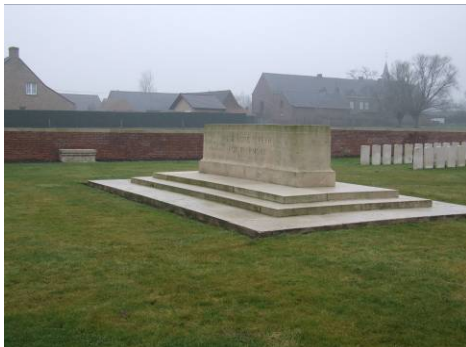
Afbeelding 1: Stone of Remembrance van La Clytte military cemetery, Klijte

levensbeschouwelijke zienswijzen en niemand tegen de borst stoten, maar het moest daarnaast ook het Christelijke karakter van het Britse Rijk tonen. Er werden zodoende ook twee monumenten ontworpen. De “Stone of Remembrance” en het “Cross of Sacrifice”. Al tijdens de oorlog ontwierp de Lutyens de “Stone of Remembrance”. Dit was een ontwerp dat Kenyon overnam en het idee was dat het een soort altaar vormde op de begraafplaats. Een altaar was een symbool dat binnen alle levensbeschouwingen een functie kon hebben en zelfs voor niet gelovigen waarde had. Het ontwerpproces van de Stone geeft een aardige inkijk in hoe een herkenbaar collectief identiteitverlenend symbool tot stand kwam. Dit ging niet zo vloeiend als dat vermoed zou worden.