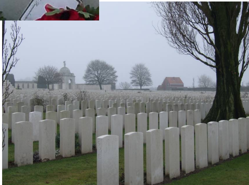
Tyne Cot cemetery, Zonnebeke