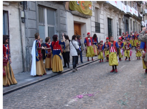
Fotografía 1.6: Acompañantes durante la 2ª Diana. 23 de Abril del 2010

Mediante esta nueva figura festiva, las mujeres hemos sido introducidas a las festividades, en base a otro de los modelos de género aceptados el de “mujer-madre”, esta es la razón por la que estos tipos de feminidad compartan el peldaño en la pirámide alcoyana. En el acto de l’Entrà mientras que los hombres marchan juntos con su grupo de iguales, exhibiendo su control y poder, las mujeres desfilan solas, reproduciendo características femeninas estereotipadas en las sociedades occidentales, tales como: la pasividad, la dulzura, la maternidad. La mayoría de las acompañantes van repartiendo flores, hierbas aromáticas, o tocando algún instrumento detrás de sus maridos.