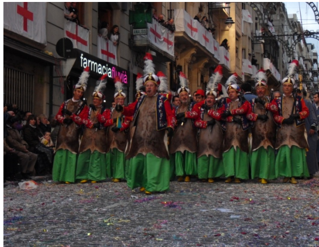
Esquadra de la filà Cordoneros. Abril del 2010

En l'Entrà cada filà tiene derecho a una formación especial llamada esquadra , compuesta por diez festeros y un cabo que les dirige. Estas formaciones han sido uno de los puntos de mayor discordia en el conflicto alcoyano, ya que una Ordenanza aprobada en Noviembre del 2004 prohíbe que este tipo de formaciones sean mixtas.