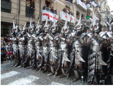
Fotografía 1.1: Esquadra de Cristianos. 22 de Abril del 2010