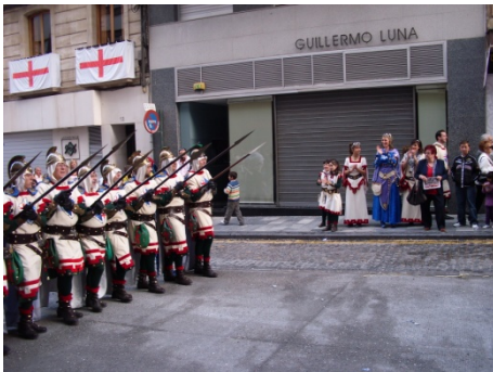
Fotografía 1.5: Acompañantes durante la 2ª Diana. 23 de Abril 2010

el resto de actos oficiales le están vetados, por lo que se nos sigue alienando en las aceras.