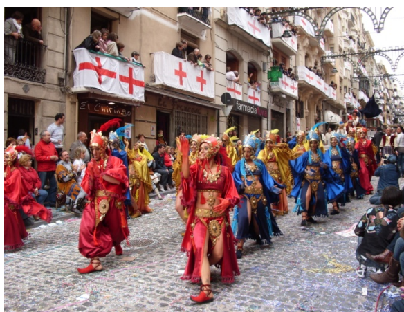
Boato de la Capitanía Mora, 22 de Abril del 2010

A las 10,30 de la mañana, mediante el grito de “ Alcoians per Alcoi i per Sant Jordi avant l’Entrà de Cristians 2010/ Alcoyanos por Alcoi y por San Jorge adelante la Entrada de Cristianos 2010 ”, da comienzo el acto más multitudinario y espectacular de la trilogía alcoyana, L’Entrà . Ésta representa la marcha militar del ejército cristiano a la batalla. Encabeza el desfile el Capitán Cristiano junto a su fastuoso séquito. Las capitanías son organizadas cada año por una filà diferente, siguiendo un orden riguroso basado en la antigüedad de cada una de estas organizaciones. En las capitanías les filaes , sacan a las calles alcoyanas el trabajo de varios años convertido en fantásticos espectáculos llenos de color, música e imaginación. Cada capitanía es organizada para la ocasión con todos sus elementos: trajes, carrozas, espectáculos, música y coreografías. Los sequitos que acompañan al capitán durante el desfile son conocidos como boatos , y estos han sido los espacios habituales de participación femenina, “desempeñando un rol puramente ornamental (...) acompañando coreográficamente [a través de bailes] o exhibicionista, desfilando subida a carrozas, caballos” (Vicent Borrego y Gil-Manuel Hernández; 1999:267).