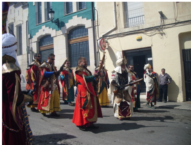
Capitán Moro durante la batalla. 24 de Abril del 2010

A las 10 de la mañana un jinete del bando moro lleva al castillo, donde están atrincherados los cargos del ejército cristiano, un mensaje del Capitán Moro en el cual se solicita la rendición cristiana. Este mensaje es repudiado por los Cristianos, así el jinete corre veloz por la calle San Nicolás (centro neurálgico de las festividades) a comunicar la negativa a su Capitán. Éste en un intento de negociación, envía a su Embajador al castillo. Aquí empieza el acto de L' Embaixà , una representación teatral en la que el embajador del ejército moro insta a la rendición al castillo. Ante la falta de acuerdo empieza las batallas por las calles del centro de la ciudad. La guerra culmina el mediodía con una lucha con espadas ante la puerta del castillo. La batalla es ganada por el ejército moro, izando la señera de la media luna en el castillo.