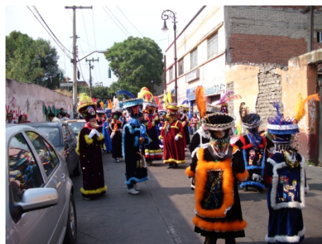
Danza de Moros y Cristianos. Xochimilco (México), Junio de 2010