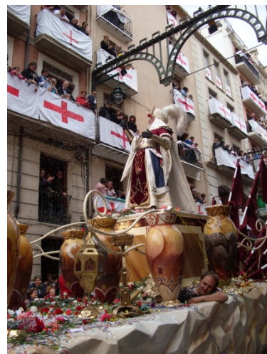
Fotografía 1.4: Capitán Moro 22 de Abril del 2010

La masculinidad descrita en este primer apartado se ubica en la cúspide de la pirámide del prestigio social, ya que la dimensión social que adquiere la fiesta en la