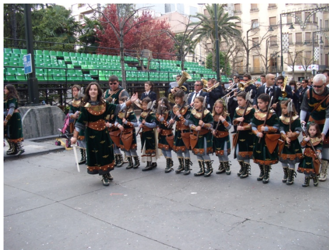
Esquadra de niñas. 2ª Diana, 23 de Abril 2010

esquadres femeninas formadas por niñas y adolescentes, portando el traje femenino de sus respectivas filaes .