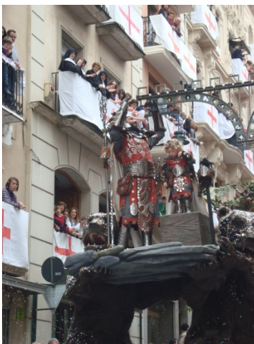
Fotografía: 1.3: Alférez Cristiano 22 de Abril del 2010

La representación máxima de prestigio y poder social, dentro de las festividades alcoyanas, son los Cargos Festeros (capitanes y alféreces). Estos personajes desfilan solos sobre sus carrozas, vistiendo costosos trajes que han sido diseñados y fabricados para ellos con lujosas telas y brillantes metales. Los Cargos Festeros muestran simbólicamente su poder, gesticulando con sus manos para conseguir el aplauso de las personas espectadoras. La norma general es que las personas que ostentan estos cargos, se encuentren entre las clases más adineradas de la comunidad, exhibiendo así su poderío económico y su posición en la sociedad alcoyana. A través del ritual el poderoso ratifica simultáneamente su poder y lo reclama para sí, haciéndose querer en el entorno festivo (Enrique Gil Calvo; 1991). Entre el séquito de éstos suele estar su familia, la cual mediante la adscripción disfrutan de los niveles más alto de reputación social.