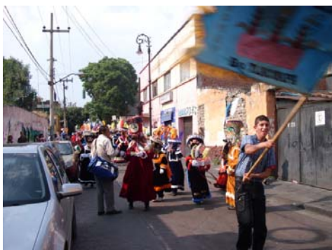
Danza de Moros y Cristianos. Xochimilco (México), Junio de 2010

festividad formando en 1814 una organización religiosa autosuficiente. En último lugar encontramos lo que el autor llama derivaciones coreográficas diversas , que es una especie de cajón de sastre donde se agrupan “un conjunto de danzas que muestran relación directa con la de moros y cristianos en cualquiera de sus variantes” (Ibid.: 154).