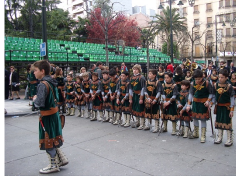
Fotografía 1.2: Esquadra de niños. 23 de Abril del 2010

La representación máxima de prestigio y poder social, dentro de las festividades alcoyanas, son los Cargos Festeros (capitanes y alféreces). Estos personajes desfilan solos sobre sus carrozas, vistiendo costosos trajes que han sido diseñados y fabricados para ellos con lujosas telas y brillantes metales. Los Cargos Festeros muestran simbólicamente su poder, gesticulando con sus manos para conseguir el aplauso de las personas espectadoras. La norma general es que las personas que ostentan estos cargos, se encuentren entre las clases más adineradas de la comunidad, exhibiendo así su poderío económico y su posición en la sociedad alcoyana. A través del ritual el poderoso ratifica simultáneamente su poder y lo reclama para sí, haciéndose querer en el entorno festivo (Enrique Gil Calvo; 1991). Entre el séquito de éstos suele estar su familia, la cual mediante la adscripción disfrutan de los niveles más alto de reputación social.