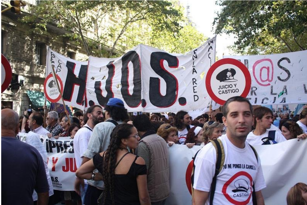
H.I.J.O.S tijdens de demonstratie op 24 maart 2010 'verjaardag' van de Coup d'etat.