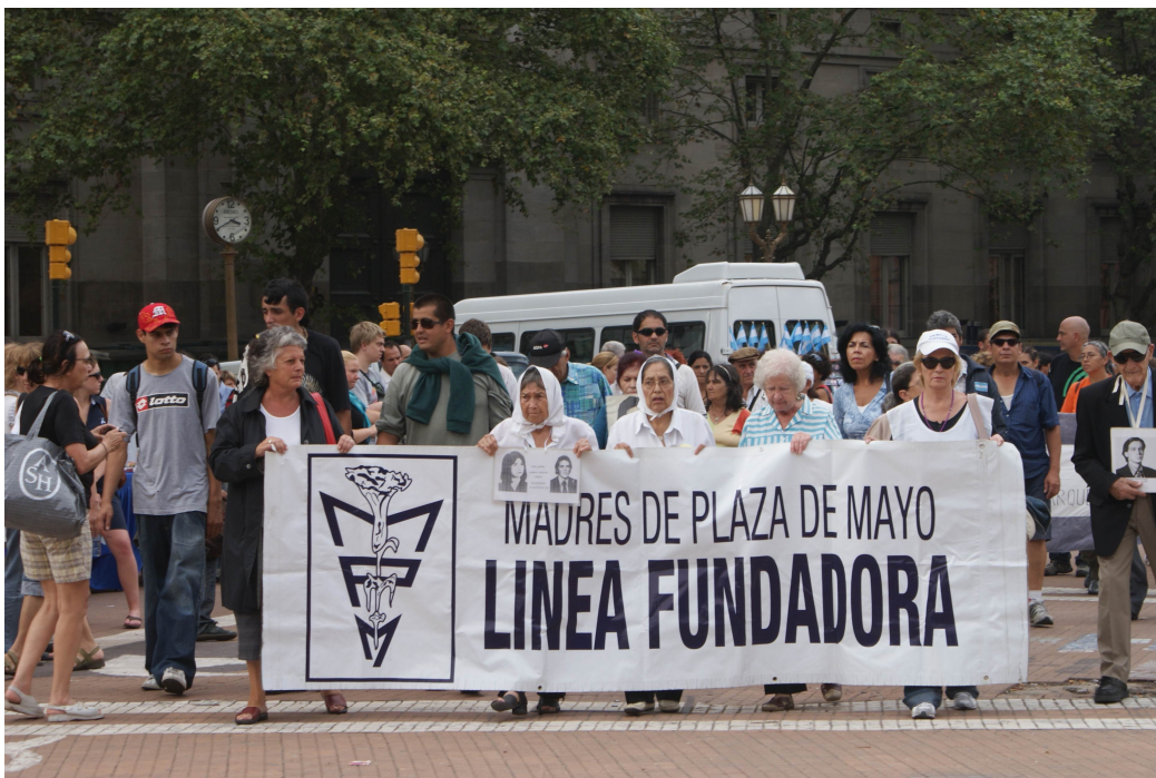
Madres de Plaza de Mayo Linea Fundadora tijdens hun wekelijkse ronde op de Plaza de Mayo maart 2010