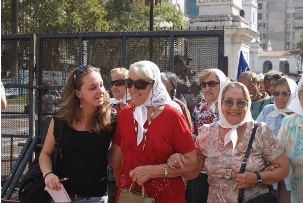
Samen met een van de Madres tijdens de wekelijkse ronde op de Plaza de Mayo