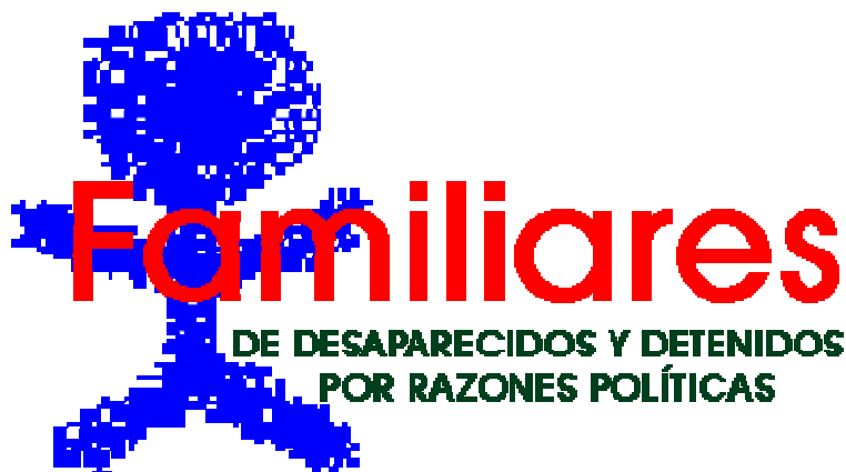
Embleem Familiares de desaparecidos y detenidos por razones politicas

Ten eerste zal ik beginnen met de eerst opgerichte organisatie namelijk ‘Familiares de desaparecidos y detenidos por razones politicas’ zoals de naam al aangeeft is deze organisatie toegankelijk voor allerlei familieleden die een persoon verloren hebben tijdens de dictatuur en is het scala aan leden erg breed, zo zijn er moeders, vaders, echtgenotes, ooms en tantes die zich hierbij hebben aangesloten. Als ik op hun website de geschiedenis van de organisatie terug lees en hoe deze tot stand zou zijn gekomen, staat er dat door de vele zoektochten heen zij elkaar hebben leren kennen. Ze deelden hun verhaal en lot en wisten vanaf dat moment dat ze niet meer alleen waren. De eerste groep Familiares is opgericht in januari 1976 in Cordoba nadat er 24 personen verdwenen waren. In maart datzelfde jaar is een groep in Buenos Aires van start gegaan. Volgens Familiares zouden er twee aspecten altijd duidelijk zijn geweest namelijk dat de verdwenen familieleden allemaal op een of andere manier in verband zouden staan met la lucha popular dat zich inzette voor de minder bedeeden in de samenleving. Hierdoor hebben zij de benaming por razones politicas er aan vast gekoppeld, zie afbeelding hieronder.