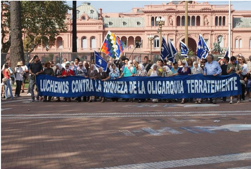
Madres de Plaza de Mayo tijdens hun wekelijkse ronde op de Plaza de Mayo maart 2010