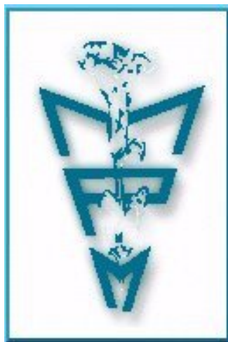
Embleem Madres de Plaza de Mayo Linea Fundadora

Aan de hand van het geschetste beeld kan ik stellen dat de doelen van beide groeperingen Madres en de andere mensenrechtenorganisaties zowel verschillend als op sommige vlaktes gelijk zijn. Laat dit ons ook een andere positionering met betrekking tot het rouw proces zien? Dit zal ik in hoofdstuk 5 verder bediscussiëren.