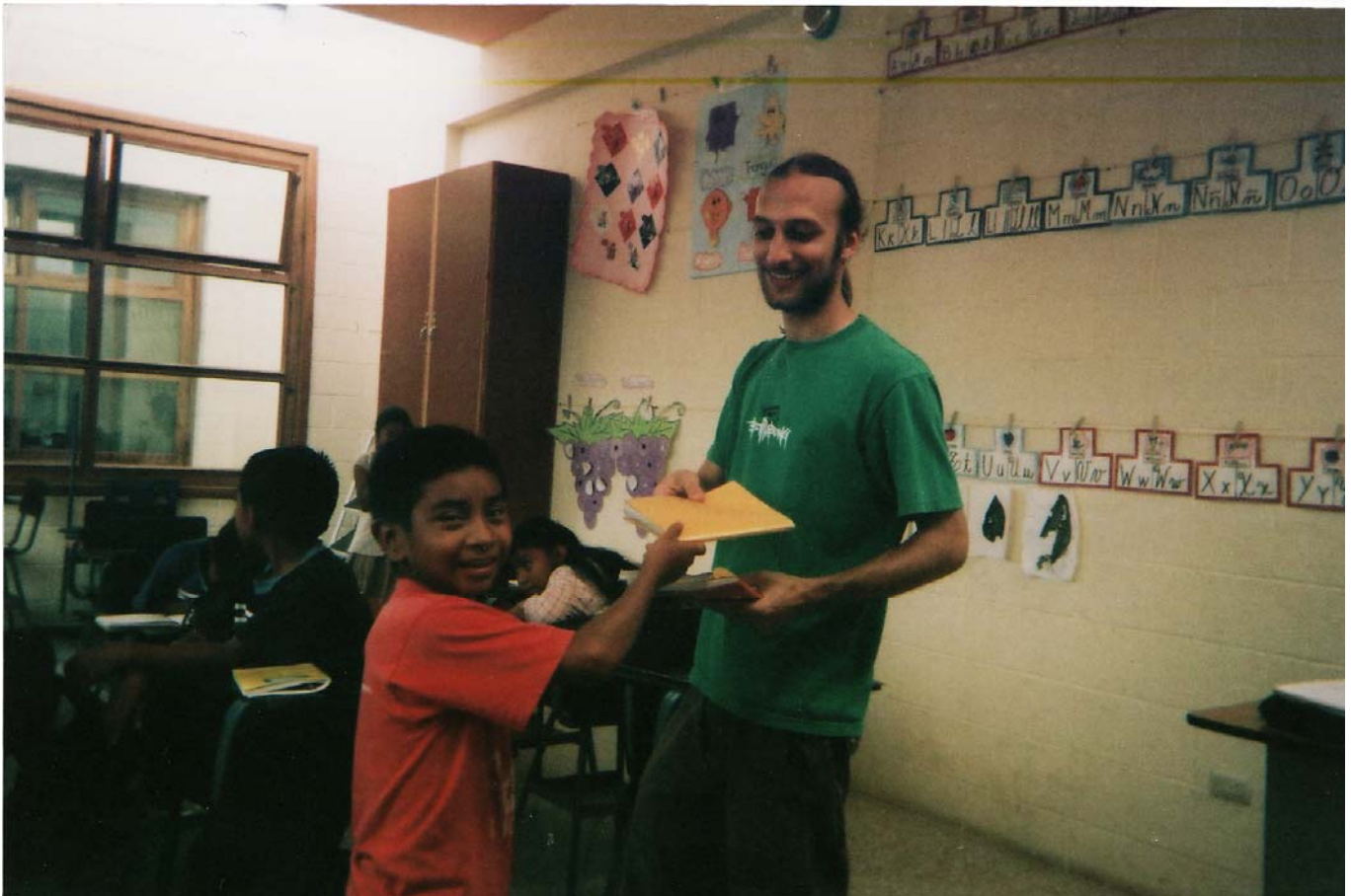
Afbeelding 5: Foto-opdracht klas 2.

In de tweede klas werkte een Spaanse vrijwilliger, waar tijdens de tien minuten dat ik binnen was voor de uitleg, wat onrust heerste. In deze klas waren 22 foto's gelukt die allemaal in de klas genomen zijn, waardoor ik vermoed dat de wegwerpcamera niet is meegenomen tijdens de pauze. Slechts veertien foto's waren met de vrijwilliger genomen.