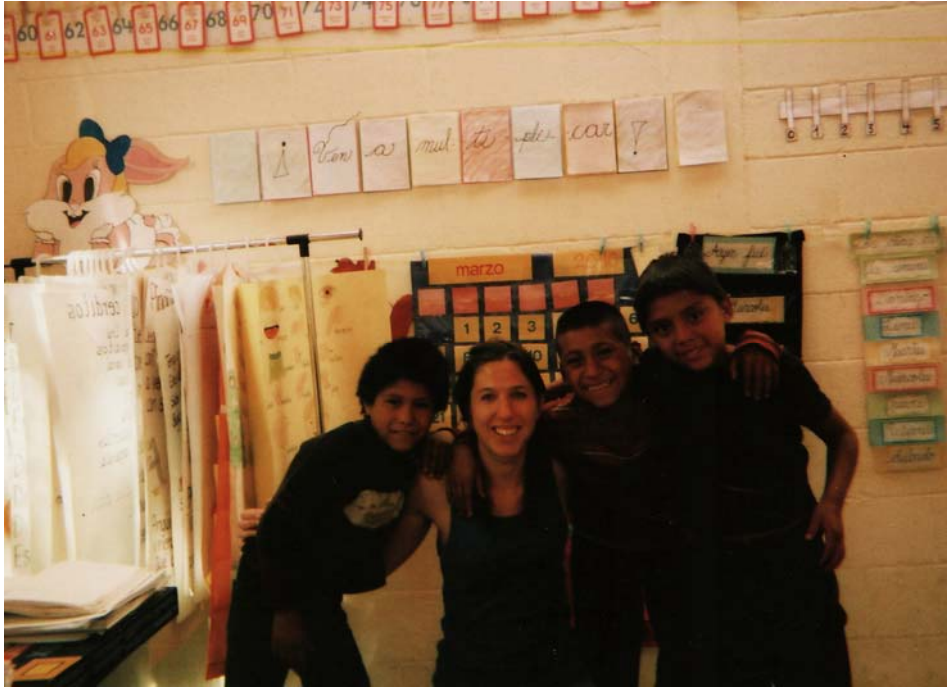
Afbeelding 7: Werkend als vrijwilliger in de klas

De schooldirecteur wilde niet dat ik bij de ouders thuis kwam, omdat hij bang was dat ze zich ongemakkelijk zouden voelen. Ik heb zijn beslissing gerespecteerd en ben niet zelf contact gaan zoeken met de ouders, omdat ik geen problemen wilde veroorzaken tussen de twee organisaties waarmee ik heb gewerkt. In plaats daarvan regelde de schooldirecteur alle interviews en informanten voor mij. Aan de ene kant was dat voor mij erg makkelijk, maar ik had soms het gevoel dat de ouders niet helemaal op hun gemak waren en mij sociaal wenselijke antwoorden gaven. De interviews werden altijd in een leslokaal of in de lerarenkamer gehouden en dit was voor de ouders geen vertrouwde omgeving. Ik heb ook geen contact met de ouders kunnen opbouwen, omdat ik ze alleen zag tijdens de interviews. Als ik in dezelfde situatie weer onderzoek zou doen, dan zou ik nog een keer in gesprek gaan met de schooldirecteur en uitleggen hoe de interviewlocatie de onderzoeksresultaten zou kunnen beïnvloeden. Ik zou met hem willen zoeken naar een meer vertrouwde interviewlocatie voor de ouders en aan hem voorstellen om aan de ouders zelf te vragen wat ze willen.