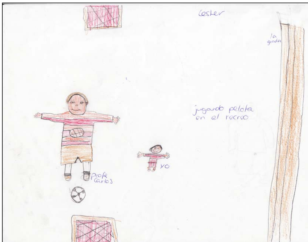
Afbeelding 2: Tekenopdracht Lester. Zijn uitleg: “ik en vrijwilliger Diego die samen voetballen tijdens pauze”.