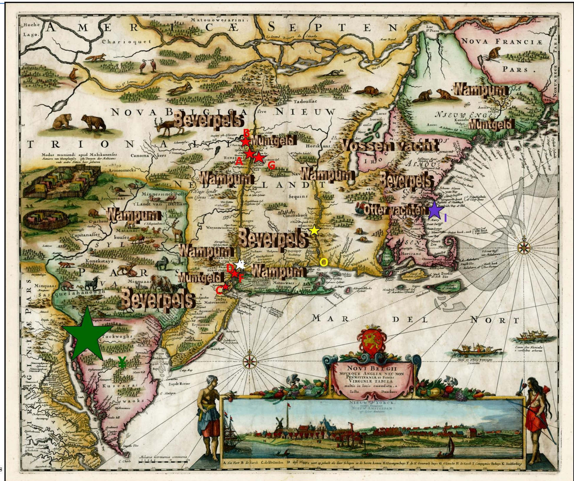
Justus Danckerts, Novi Belgii Novaeque Angliae Nec Non partis Virginiae Tabula multis in locis emendata a Iusto Danckers (Amsterdam 1685)