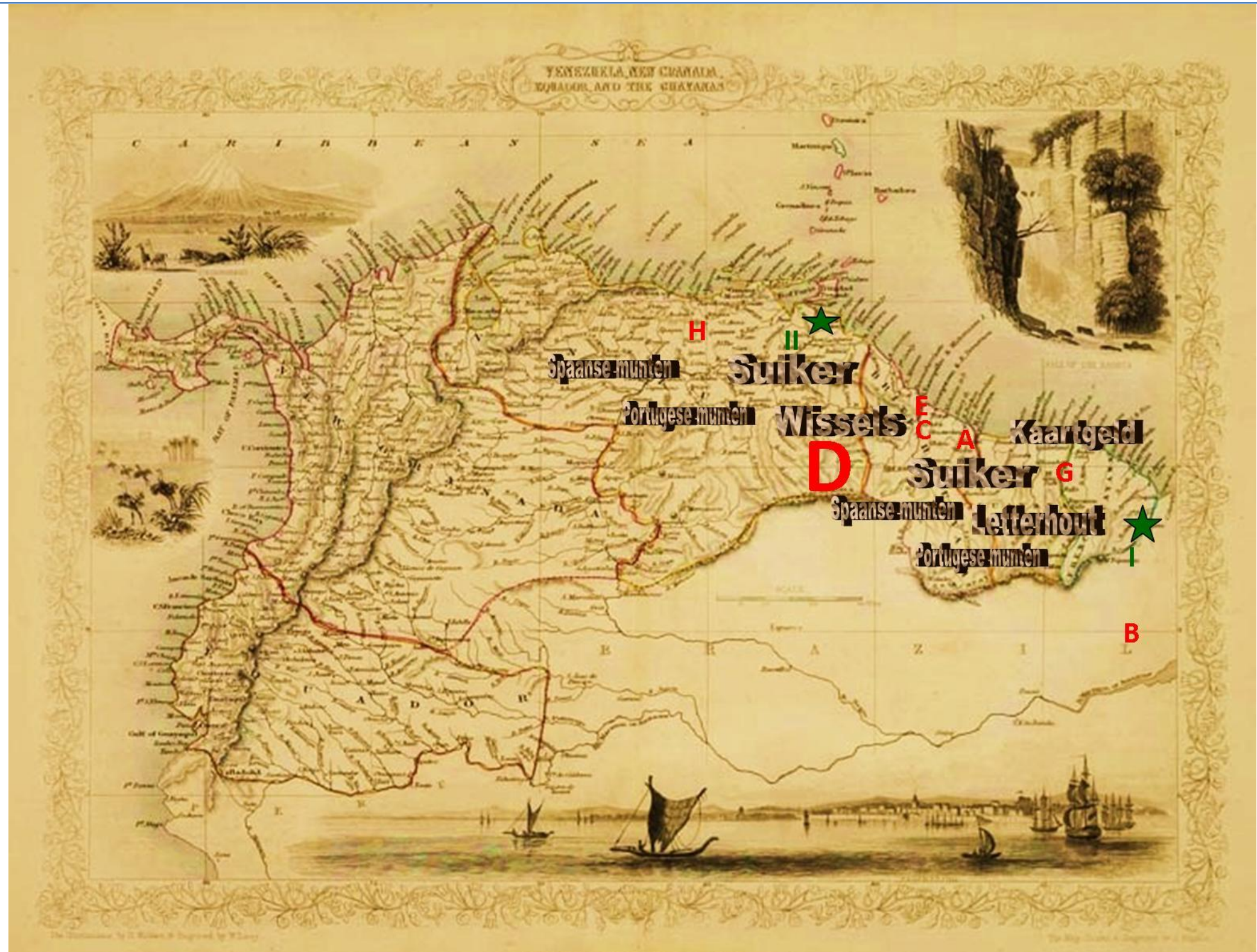
Kaart van Venezuela, De Wilde Kust en een deel van Brazilië uit: John Tallis, The Illustrated Atlas ... (Londen ca. 1853) 73. Bewerkt door M. Overdijk.