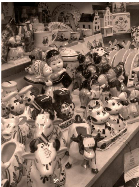
Oer-Hollandse snuisterijen in de winkel van Simon, foto gemaakt door Lotte Thissen tijdens dagje Volendam in juli 2008.