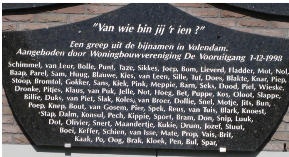
Bijnamenmonument in het centrum van Volendam.