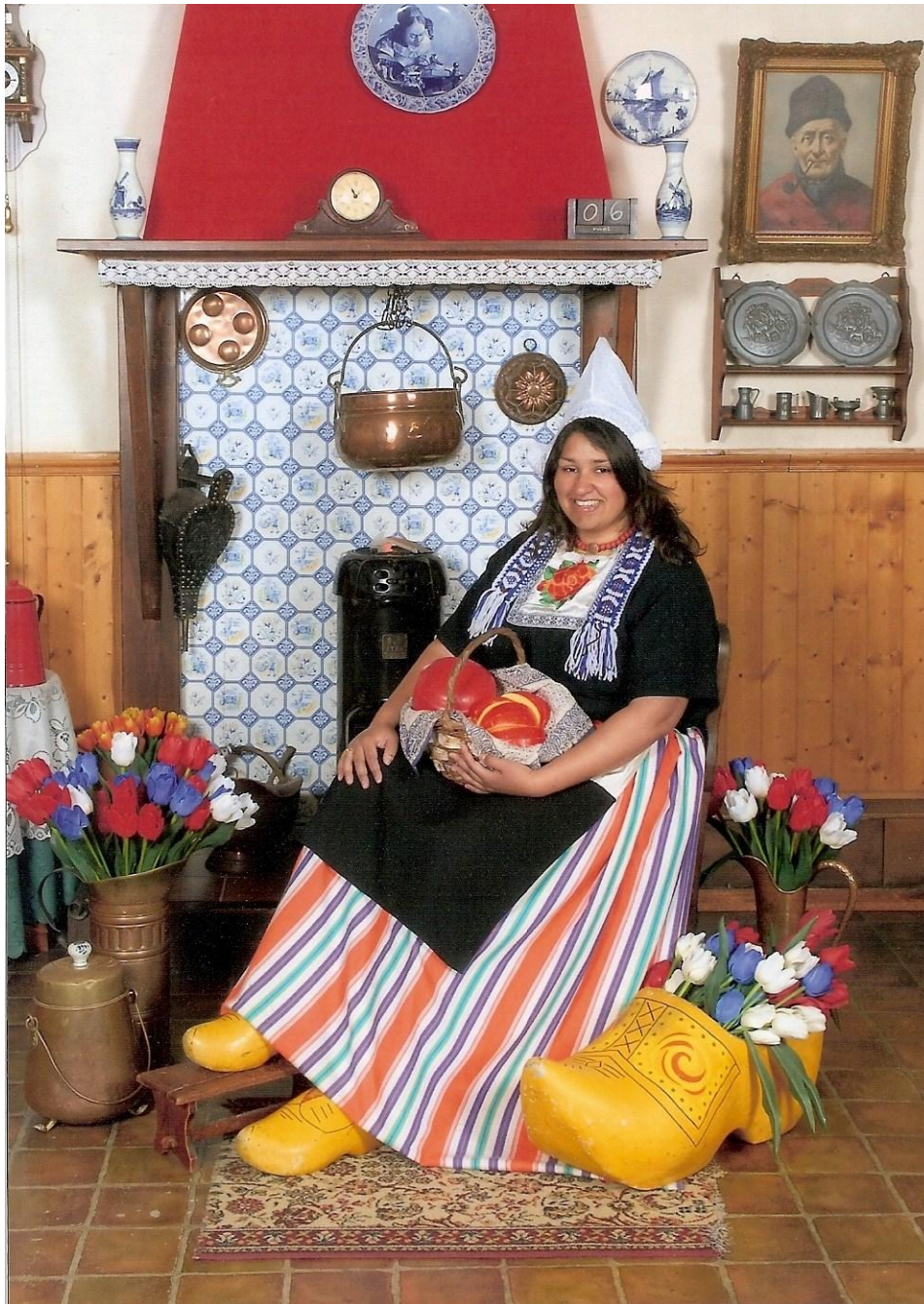
Foto in klederdracht op 6 mei 2010.