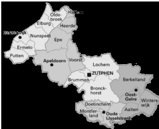
Figuur 2. Arrondissement omgeving Zutphen