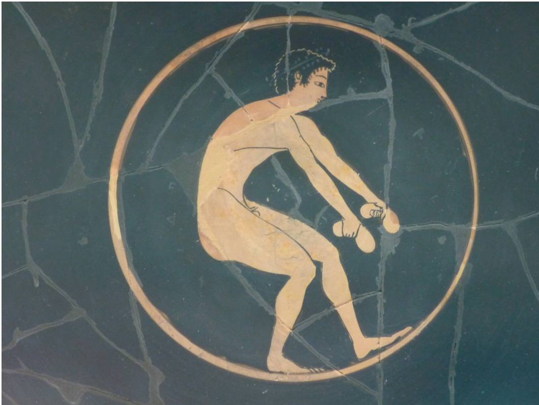
Figuur 7. Bekranste atleet met gewichten voor het verspringen in zijn handen. Gevonden op de agora, te Athene. Datering: 510–500 v.C. (Olympia, Museum of the ancient Olympics).

één van de symbolen van de overwinnaar. De overwinningskrans die in Athene gewonnen werd had echter minder betekenis dan de kransen die bij de vier spelen uit de periodos uitgereikt werden. Ze dienden enkel tot decoratie, in tegenstelling tot de kransspelen waar de kransen veel meer religieuze betekenis hadden – dit zien we bijvoorbeeld aan de vele rituelen die samenhangen met het snijden van de olijftakken voor de Olympische krans (zie ook p. 28), en aan het feit dat er aan elk van de kransen die bij de spelen uit de periodos gewonnen werd vele goddelijke krachten werden toegeschreven. Bij de spelen uit de periodos was de overwinningskrans letterlijk én figuurlijk de hoofdprijs, bij de Panathenaeën waren de prijsamforen de voornaamste prijs en gold de overwinningskrans louter als decoratie.