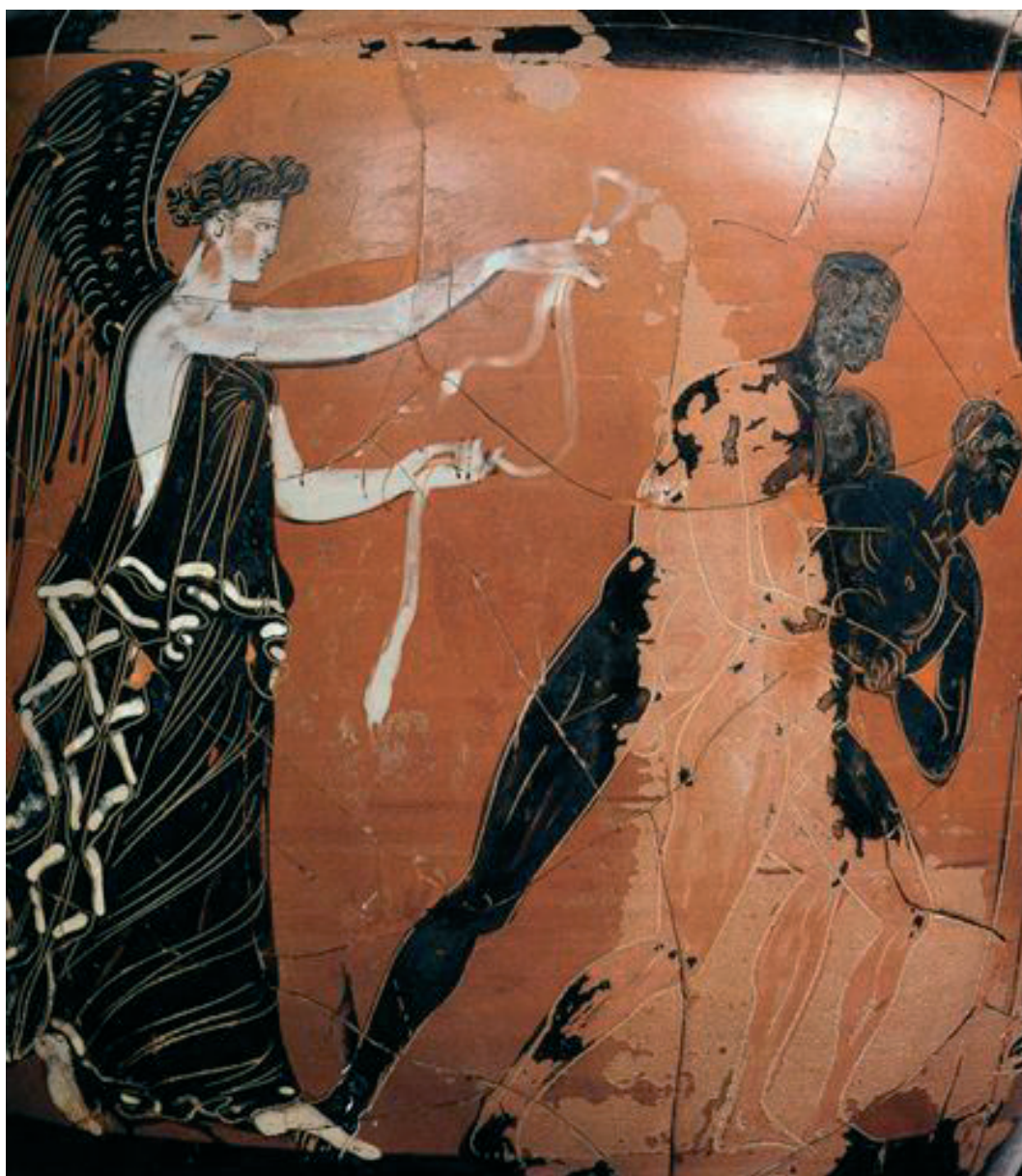
Figuur 8. Panathenaeïsche prijsamfoor. Nikè staat met een overwinningslint klaar naast een worstelwedstrijd. Datering: 363–362 v.C. (Athene, Nationaal Archeologisch museum inv. no. 20048).

Ook werden winnaars versierd met linten; een erbetoon met religieuze wortels, maar daarnaast een haast banale symbolische betekenis. Op deze manier werd de winnaar nog meer onderscheiden. Op een Panathenaeïsche prijsamfoor is te zien hoe de overwinningsgodin Nikè naast een worstelwedstrijd staat, met in haar hand een overwinningslint waarmee de winnende atleet zal worden versierd (figuur 8).