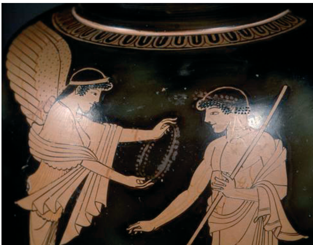
Figuur 3. Nike geeft een (reeds bekransde!) atleet een krans. Attische roodfigurige vaas. Datering: ca. 500 v.C. (Berlijn, Antikemuseen inv. 1965.5.).