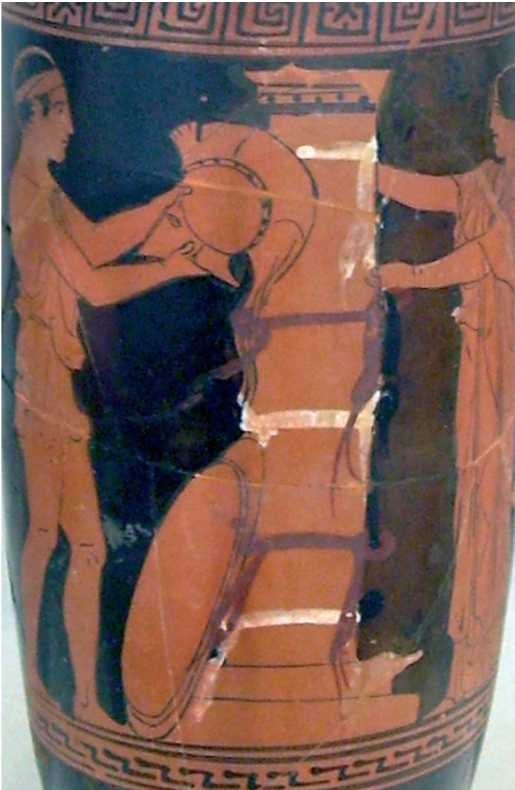
Figuur 5. Een soldaat en een vrouw hangen linten om een grafstele. Roodfigurige lekytos. Datering: ca. 430 v.C. (Athene, Nationaal Archeologisch Museum).