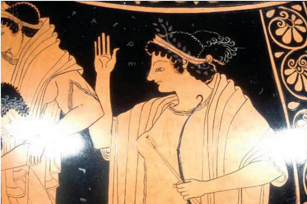
Figuur 4. Artemis met krans. Attische roodfigurige vaas. Datering: ca. 520–510 v.C. (Parijs, Louvre G 42. Foto door Maria Daniels).

Kransen onderscheidden de drager, beschermden op een zekere manier het hoofd, het belangrijkste onderdeel van het menselijk lichaam, en brachten extra status en goddelijke bescherming. Niet alleen atleten werden bekransd; integendeel, het kransen van personen kwam in het Griekse dagelijks leven veelvuldig voor. Denk bijvoorbeeld aan symposia of huwelijken. Bacchylides, een lyricus uit de zesde eeuw v.C., schrijft: