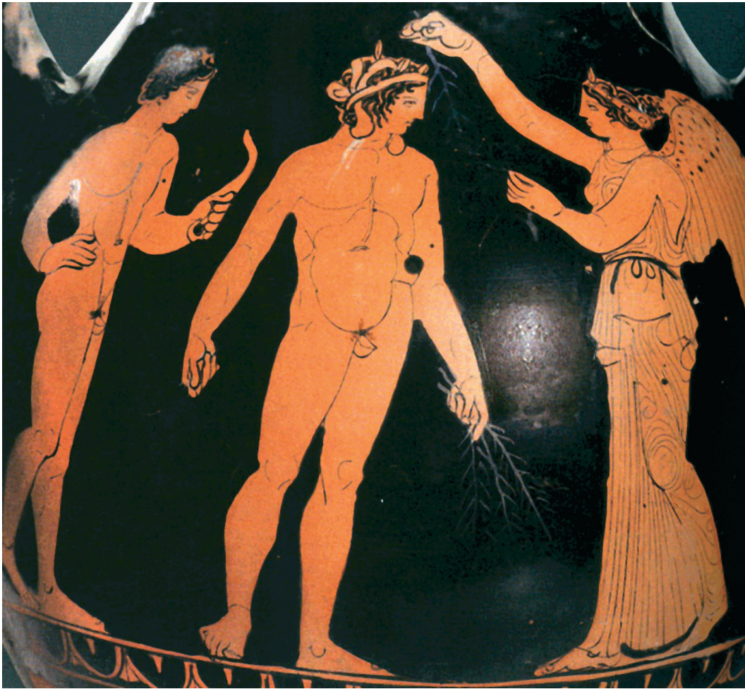
Figuur 6. Atleet met linten om zijn hoofd en palmtakken in zijn hand krijgt van een gevleugelde Nikè nog een tak voor op zijn hoofd. Links staat nog een atleet, zonder linten of takken. Wel lijkt ook hij een krans op te hebben. Hij houdt een strigilis (voorwerp om zweet, olie, en zand van het lichaam mee af te schrapen) in zijn hand. Attische roodfigurige pelike (soort amfora). Datering: laat vijfde eeuw v.C. (Wenen, Kunsthistorisches Museum IV 769).