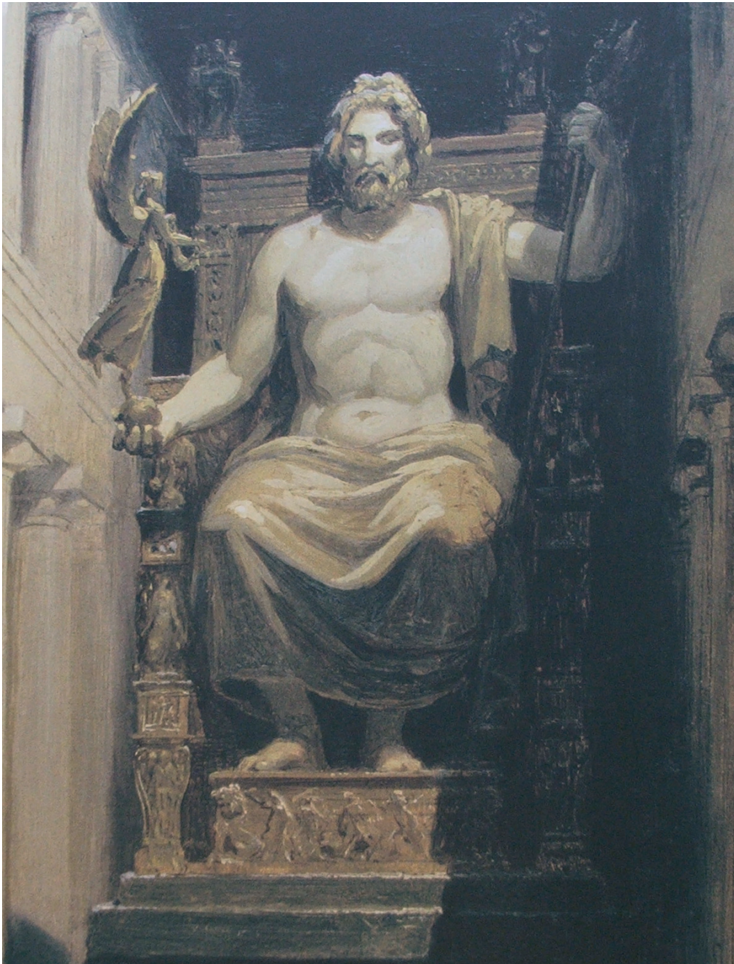
Figuur 1. Reconstructie van het Zeusbeeld te Olympia.

ningskransen uitgereikt, maar op verzoek van wederom het orakel te Delphi werden er vanaf de zesde editie van de spelen olijfkranen uitgereikt aan de winnaars. 15 In hoofdstuk 3.1.3. zal hier uitgebreider op worden ingegaan.