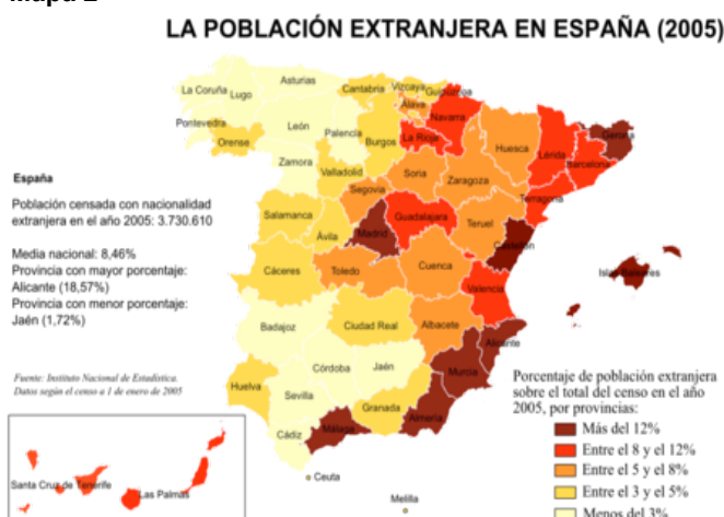
Mapa 2 11

Los mayores porcentajes de inmigrantes en proporción con la población autóctona se encuentran en las Baleares (17,5%), la Comunidad de Madrid (14,5%), las Islas Canarias (13,7%) y en la Región de Murcia (13,3%). También en Melilla, una de las dos ciudades autónomas de España que se encuentran en el continente africano, el porcentaje de inmigrantes sobre la población total es muy elevado, ya que el 19,1% de la población es de origen foráneo. Las comunidades con los menores porcentajes de inmigrantes en proporción con la población autóctona son Extremadura (2,6%), Asturias (4,5%) y Castilla y León (4,8%). 10