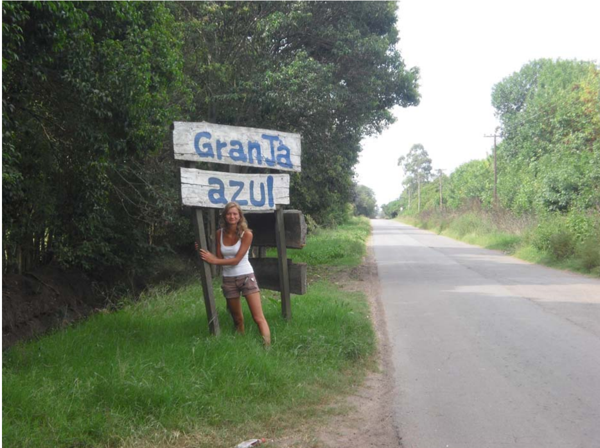
Foto van mezelf tijdens het veldwerk

Ik heb heel veel geleerd tijdens mijn onderzoek, zowel over de methode en technieken van onderzoek doen als over het leven van mijn informanten.