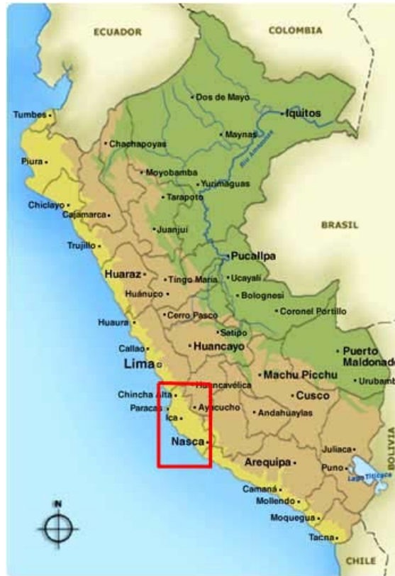
Figuur 1: De ligging van Ica in Peru