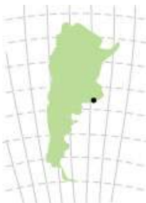
Kaart 2: Ligging van Tres Arroyos in Argentinië