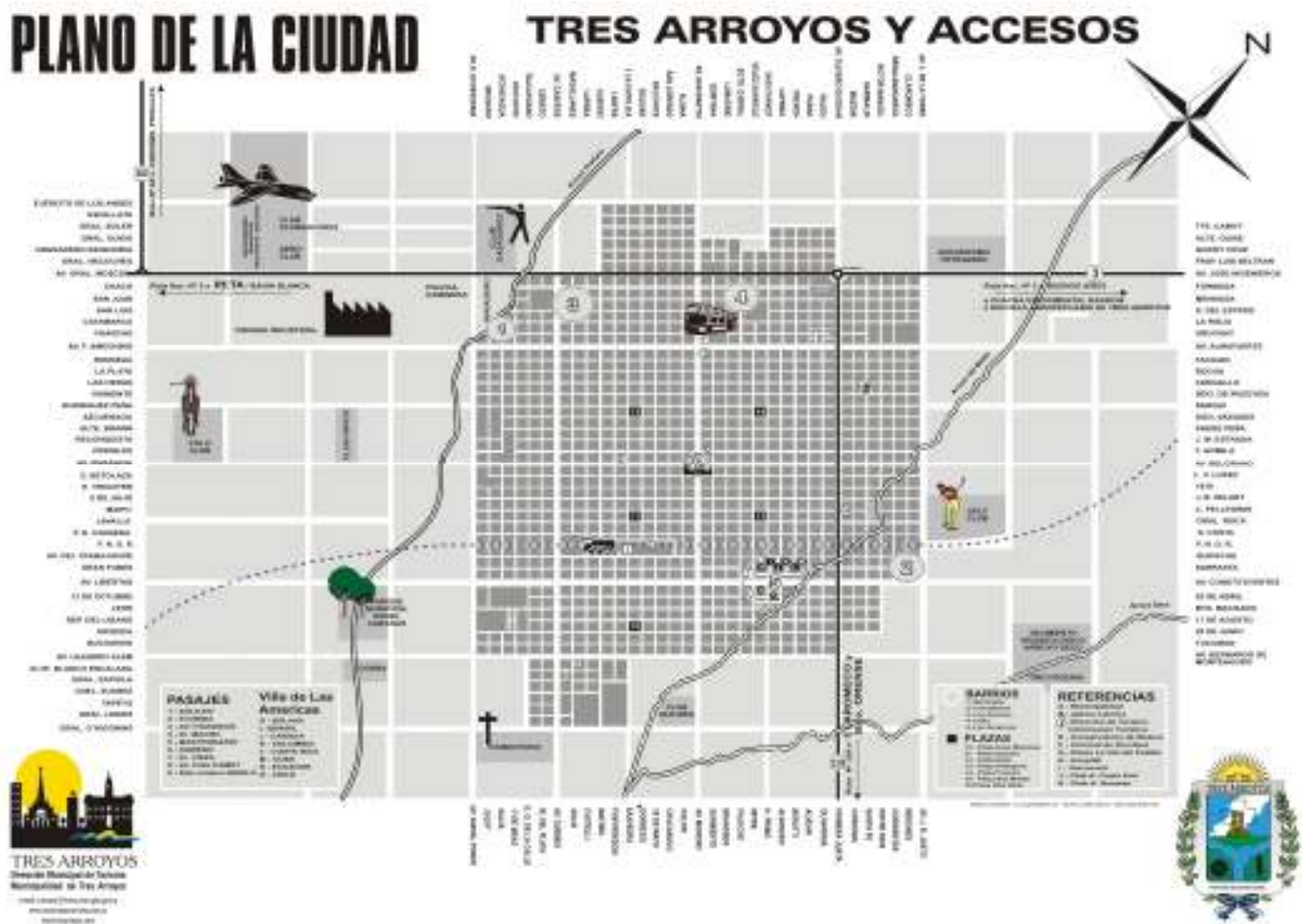
Kaart 1: Plattegrond van Tres Arroyos