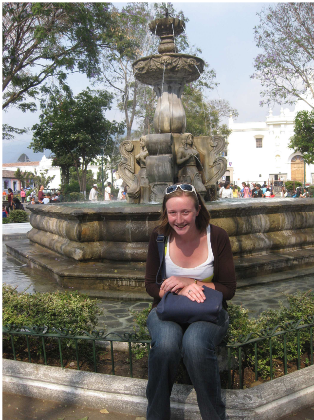
Ik in het Parque Central tijdens de Semana Santa.