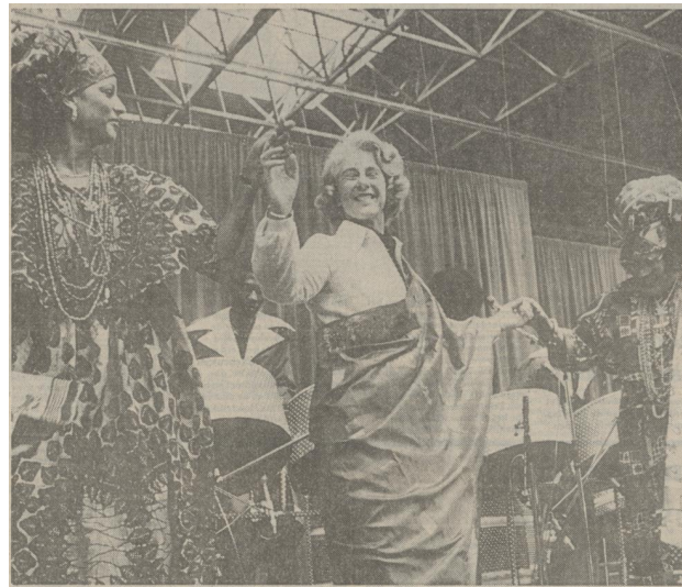
Afbeelding 7: Gardeniers bij een opening in de RAI. 195