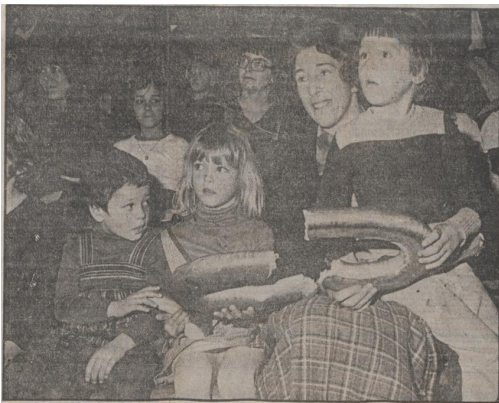
Afbeelding 9: Gardeniers met kinderen op school bij het jeugdtheater. 197