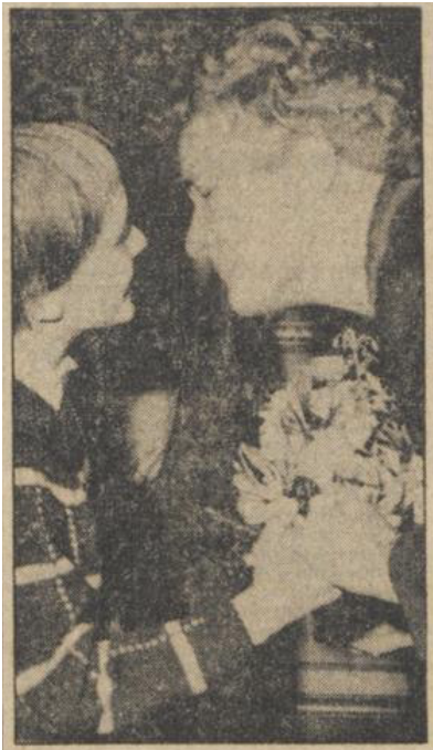
Afbeelding 1: Klompé krijgt bloemen van de dochter van minister Cals en wordt beloond met een kus. 189