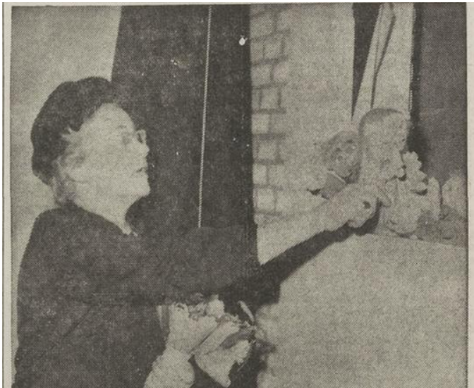
Afbeelding 3: Schouwenaar bij een poppenkast tijdens de opening van een clubhuis. 191