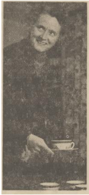
Afbeelding 2: Klompé met kopjes thee. 190