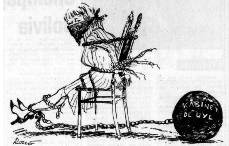
Afbeelding 12: spotprent over Vorrink. 200