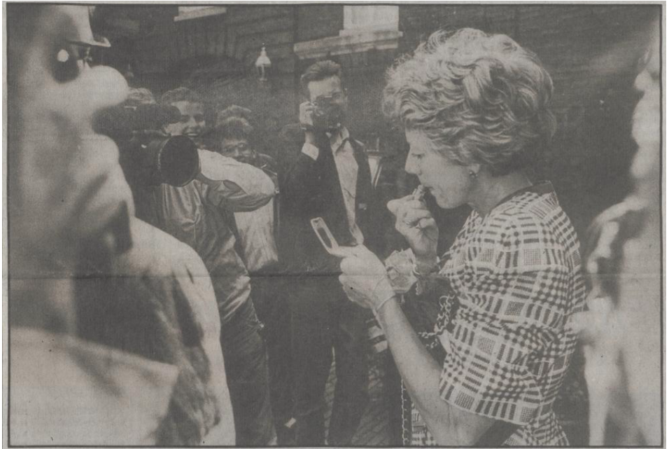
Afbeeldingen ter illustratie van ministers Marga Klompé en Neelie Kroes. 1

MA scriptie | History of Politics and Society