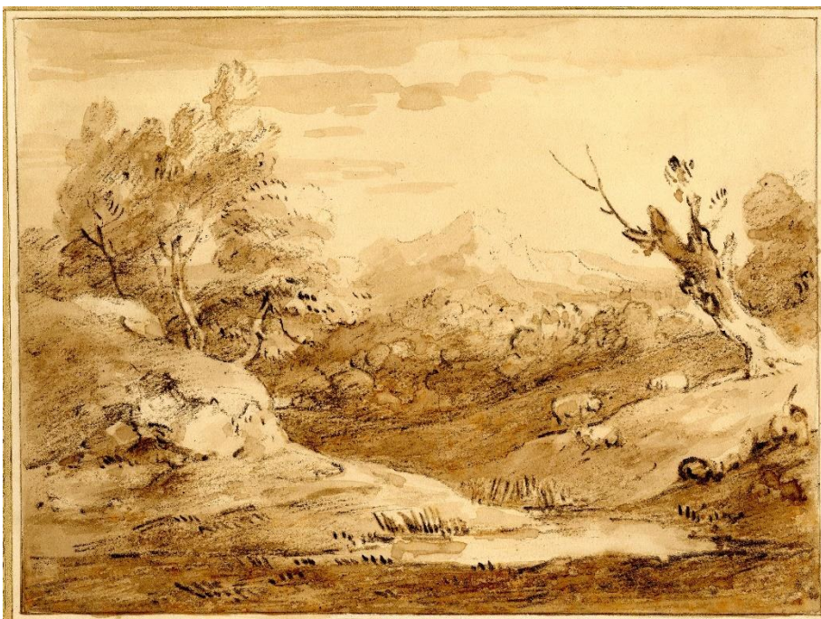
Afb. 16. Thomas Gainsborough, drawing; offset, 1780-1785, penseeltekening in bruine wassing over een offsetlijn, 200 x 267 mm., The British Museum, Londen, 1859,0806.428.