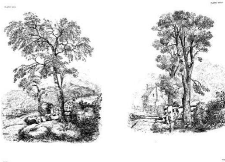
Afb. 6. David Cox, Plate XXII en XXIII. Birch, Elm.