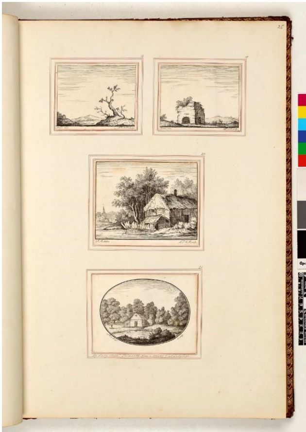
Afb. 7. Lady Amabel Hume-Campbell, Countess De Grey, Z.t., 1766-1805, ets, 91 x 113 mm. (alleen van de tekening rechtsboven), The British Museum, Londen, 1931,0413.324.