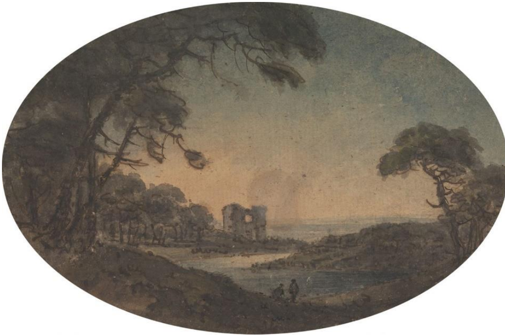
Afb. 13. William Gilpin, Landscape with Two Men and a Castle Ruin on the Riverbank, 1783, verf op waterbasis, grafiet, pen in bruine inkt en in zwarte inkt, 146 x 225 mm., Yale Center for British Art, B1998.32.10(1).