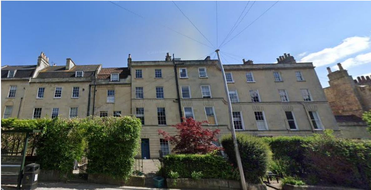
Afb. 9. Percy Place, Bath, Engeland.