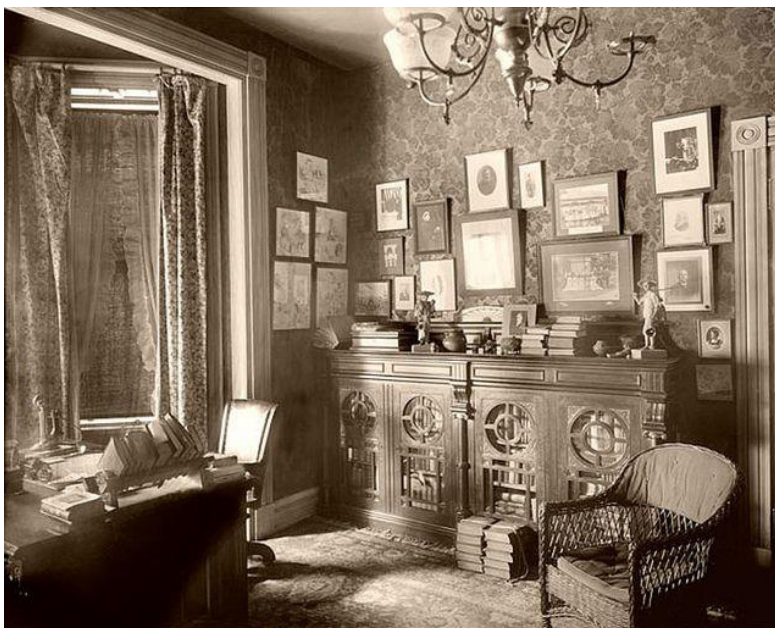
Afb. 8. Flickr, Dining room 1890's.