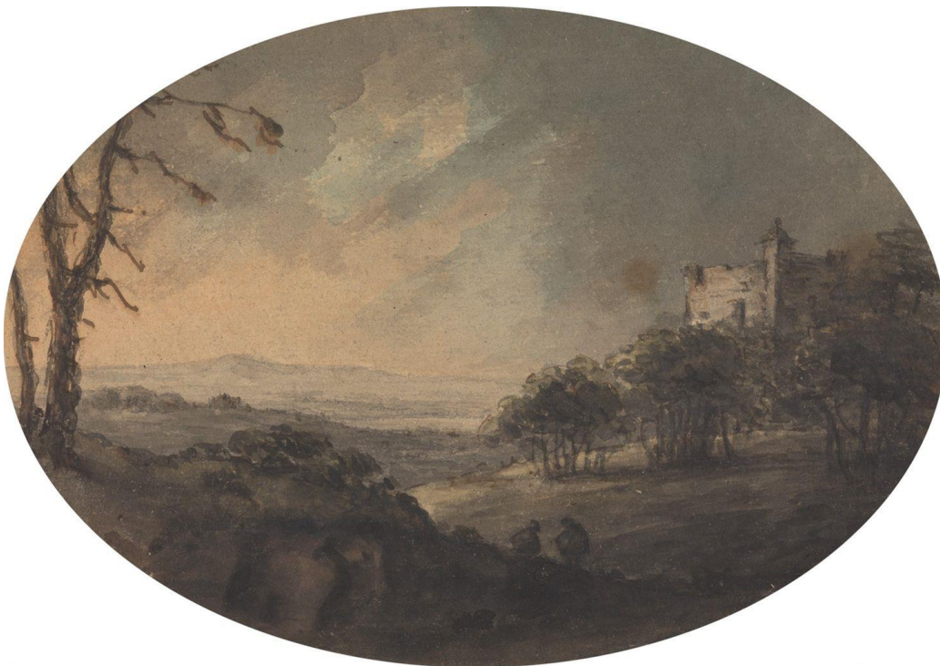
Afb. 14. William Gilpin, Landscape with Two Men on a Hill and a Castle in the Distance, 1783, verf op waterbasis, grafiet, pen in bruine inkt en in zwarte inkt, 167 x 238 mm., Yale Center for British Art, B1998.32.10(5).