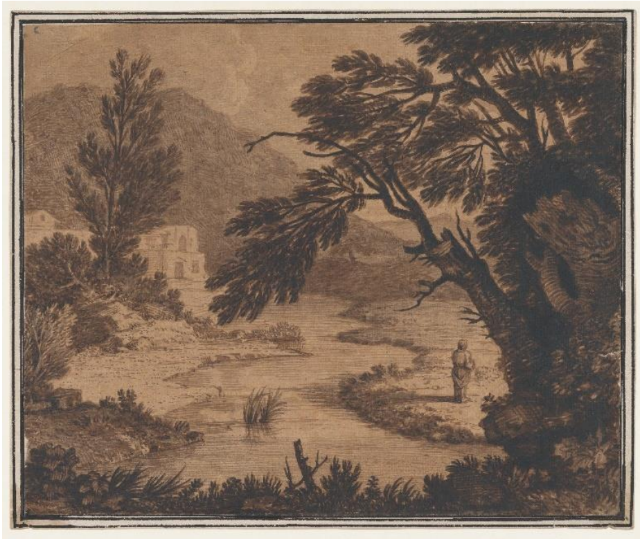
Afb. 15. Alexander Cozens, Figure in a classical landscape, 1755-1765, bruine en zwarte inkt, 180 x 217 mm., The Metropolitan Museum of Art, New York, 2017.347.