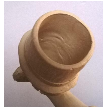
Figuur 3: Binnenkant kop.

Uiteindelijk bleef het maken de kop van een pijp deels handwerk, omdat er arbeiders nodig waren (in dit specifieke geval meestal vrouwen) die de binnenkant van de kop 'openmaakten'. 93 Dat dit gebeurd is, zien we op figuur 3. Aan de binnenkant van de kop zijn stukjes te zien waar 'gesmeerd' is, waarschijnlijk om oneffenheden of kleine gaatjes weg te halen. Geheel onderin zit overigens een klein gat waardoor de tabaksrook via de steel in de mond gezogen kon worden. Dit spreekt natuurlijk voor zichzelf, maar het gaatje moest wel in de kop komen en daar waren arbeiders voor nodig.