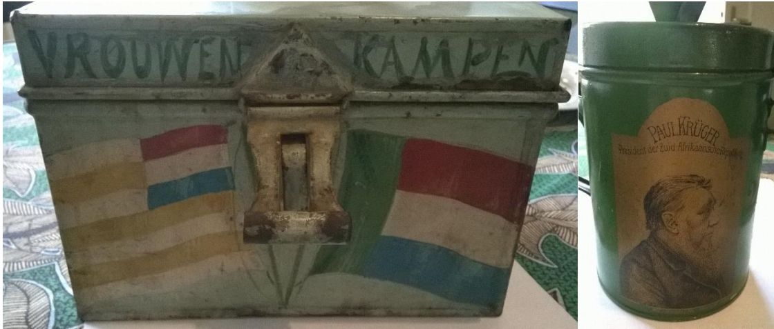
Figuur 4 Collectebussen voor de Boeren (bron: Zuid-Afrikahuis (ZAH) Amsterdam).