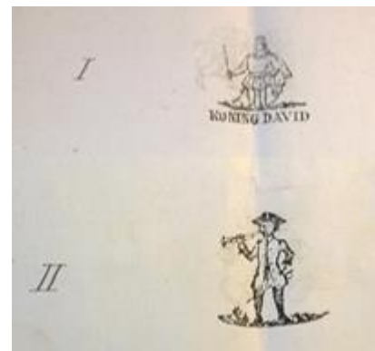
Figuur 2: Twee van de in 1881 ingeschreven merken.

In 1880, als Tobias inmiddels overleden is, richt Pieter Goedewaagen met zijn zoon Aart de firma P. Goedewaagen & Zoon op. Een jaar later, op 19 juli 1881, schrijft deze nieuwbakken firma dertien verschillende merken voor op de pijpen in bij de rechtbank van het arrondissement Rotterdam (zie figuur 2). 78 Deze merken zien we vanaf dat moment op vele plaatsen en in vele jaren terug, van de inventarislijsten tot en met de catalogi.