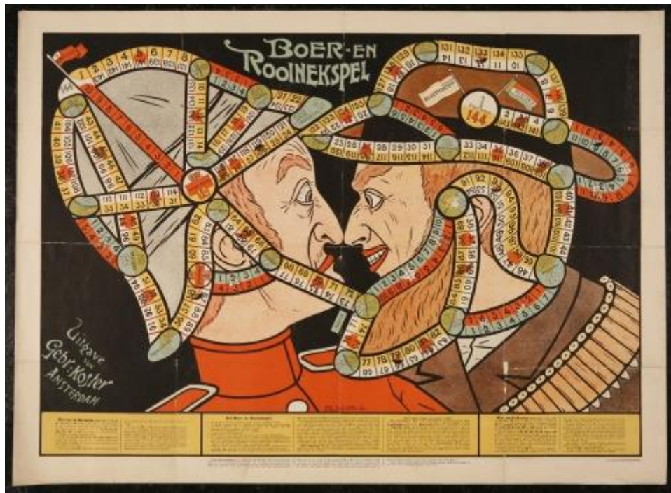
Figuur 8 Het Boer- en Rooinekspel. Deze versie van het speelbord is van papier.