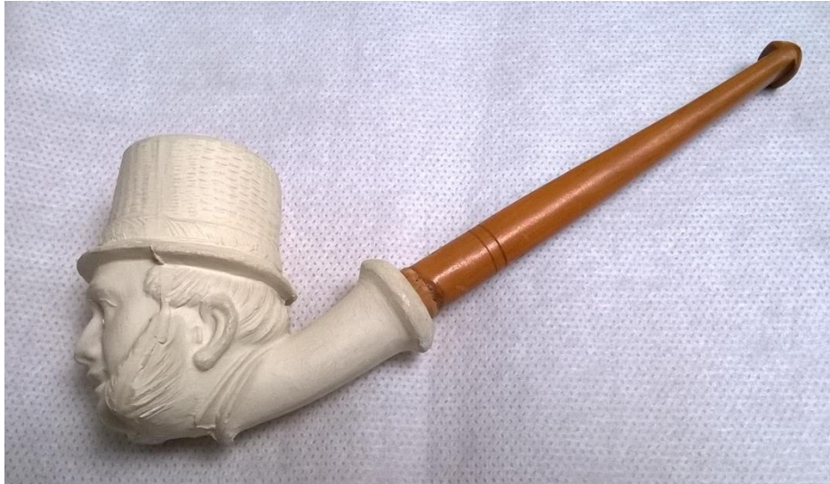
Figuur 1: Tabakspijp met beeltenis van Paul Kruger (bron: eigen collectie).