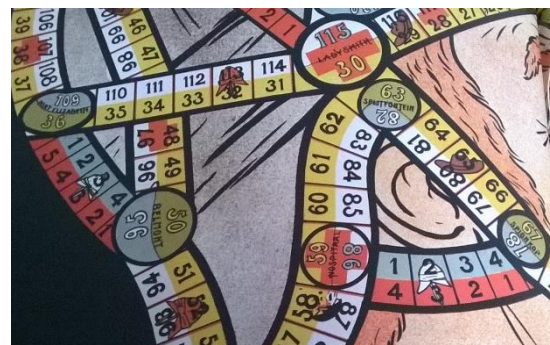
Figuur 10 Detail Boer en Rooinek: de rood-blauwe speellijnen waarover je terug moet naar een eerder vakje (bron: eigen collectie).

Slangen en ladders is een spel dat wordt gespeeld op een bord van 8 bij 8 vakjes. Spelers moeten, zigzaggend van linksonder naar linksboven spelen. 161 Zij spelen met twee dobbelstenen en hebben als doel zo snel mogelijk bovenaan te komen. Op sommige vakjes vindt een speler een ladder, op andere een slang. Kom je op een vakje waar de voet van een ladder op staat, dan mag je de ladder ‘beklimmen’ tot het vakje waar deze eindigt. Kom je op een vakje met het hoofd van een slang, dan moet je terug naar het vakje waar de staart van de slang eindigt. Bij het Boer- en Rooinekspel zien we het element van de ‘slang’ terug op het bord in de vorm van het bepaalde vakjes waar rood-blauwe lijnen aan