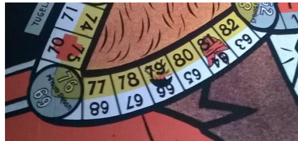
Figuur 11 Detail Boer en Rooinek: te zien zijn het 'rode kruis' op 70/75, de 'bom' op 66/79 en de 'Engelse helm' op 64/81.

Laatstelijk zijn er ook nog icoontjes op het speelbord geplaatst die voor beide teams dezelfde betekenis hebben (zie figuur 11). Een ‘Transvaalse hoed’ betekent dat je drie fiches in de eigen pot moet storten en drie plaatsen vooruit mag. Een ‘Engelse helm’ verplicht op eigen terrein een fiche in de pot te doen en twee nummers achteruit te gaan. 166 Op vijandelijk terrein moet je eveneens twee nummers achteruit, maar mag je een fiche uit de vijandelijke pot. Kom je op een ‘rood kruis’, dan dien je een fiche in de pot te storten. Bij een ‘bom’ raak je twee fiches kwijt en moet je drie nummers terug.