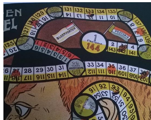
Figuur 9 Detail Boer en Rooinek: plaatsnamen op het speelbord.

Het bord wordt precies in tweeën gedeeld en aan beide kanten zijn vele vakjes met plaatsnamen en iconen (zie figuur 9). De plaatsnamen zijn verschillend van aard. Er zijn hoofdsteden van beide partijen – Kaapstad voor de Britten en Pretoria en Bloemfontein voor de Boeren – en andere plaatsen waar slagen zijn geleverd, bijvoorbeeld Colenso, Spionkop en Ladysmith. Eveneens zien we verschillende iconen: een Transvaalse hoed, een bom, een Engelse helm, kruizen van het Rode Kruis en de vlaggen van de strijdende partijen. Over de betekenis van de iconen later meer.