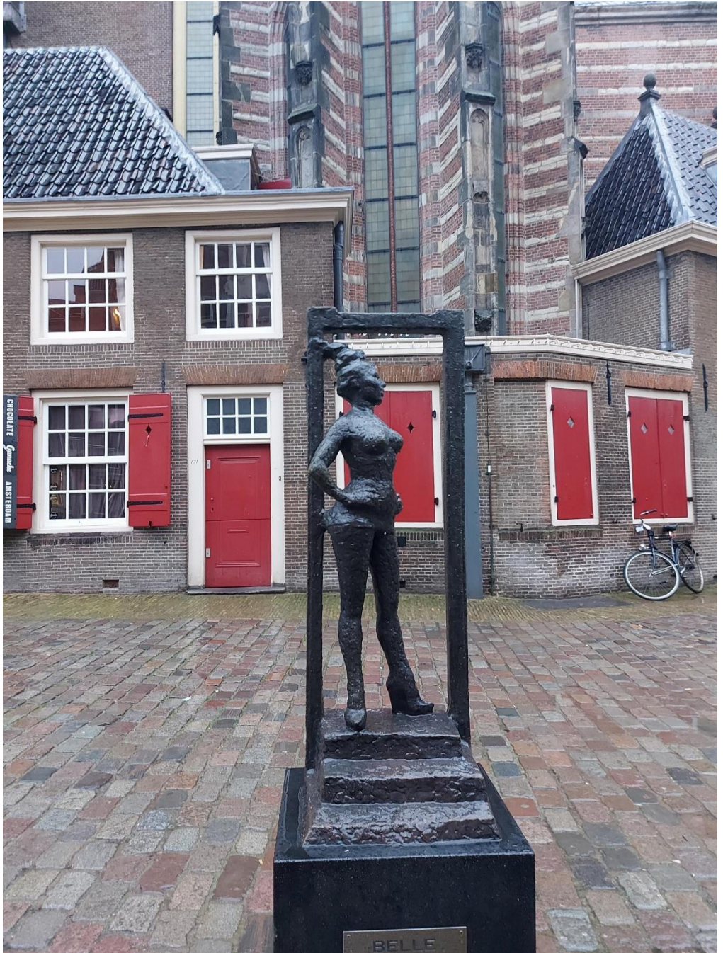
Standbeeld 'Belle' op het Oudekerksplein in Amsterdam, een eerbetoon aan sekswerkers wereldwijd