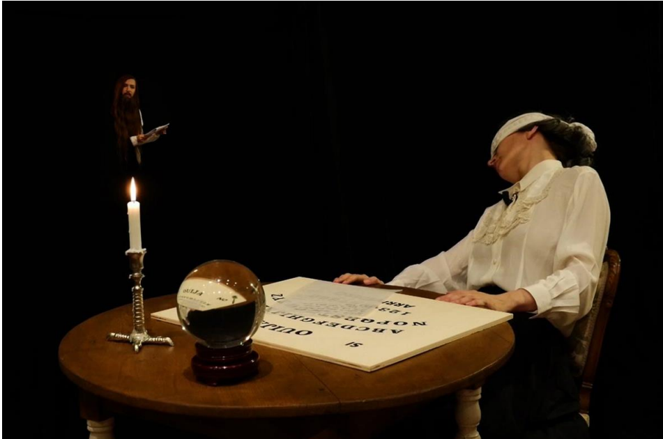
Afb. 2: Chiara Fumai, The Book of Evil Spirits , 2015, videowerk met geluid.