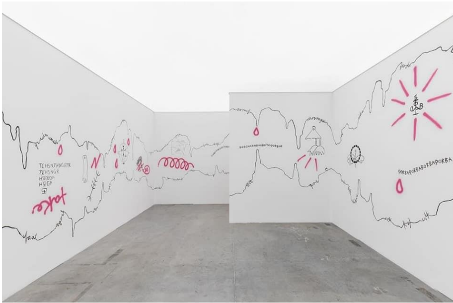
Afbeelding 3: This Last Line Cannot Be Translated , 2017, muurschildering, verschillende afmetingen, (foto: Alley Oop https://alleyoop.ilsole24ore.com/2019/10/07/biennale-labirinto/?refresh_ce=1 , geraadpleegd 30 mei 2023).