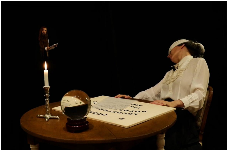
Afbeelding 2: Chiara Fumai, The Book of Evil Spirits , 2015, videowerk met geluid, (foto: DAI Roaming Academy https://dutchartinstitute.eu/page/7935/waterside-contemporary-is-pleased-to-present-the-book-of-evil-spirits-an-expan , geraadpleegd 30 mei 2023).