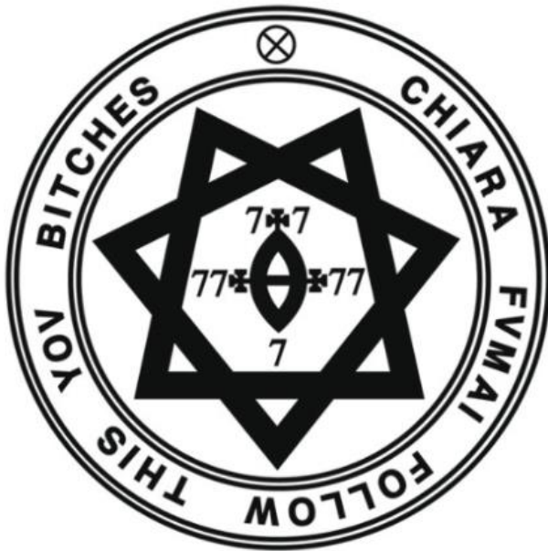
Afbeelding 2: Chiara Fumai, Follow This You Bitches , 2013, zegel en installatie, verschillende materialen en afmetingen, (foto: Premio Lum http://premio.lum.it/articolo/30012012-%E2%80%9Cfollow-you-bitches%E2%80%9D-chiara-fumai-praga , geraadpleegd 30 mei 2023).