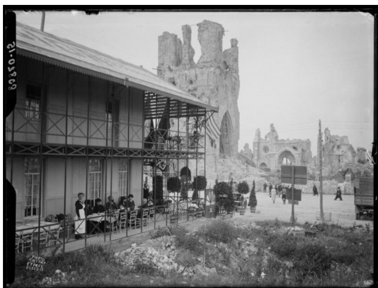
Figuur 5: Ypres – Hotel Restaurant Excelsior op de Grote Markt, 08-08-1920.

Halverwege 1919 trekken de eerste personen terug naar Ieper, gesteund door de terugkeerpremie en steungeld van het Koninklijk Besluit van 23 juli 1919. Hierbij