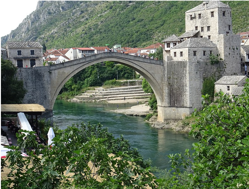
Figuur 20: Djani Behram, 'Stari Most (Old Bridge) Mostar, 18 juni 2019 (Wikimedia Commons)

of communities from diverse cultural, ethnic and religious backgrounds-'. 182 De inwoners van de stad zagen het echter anders; voor hen was de brug die was herbouwd niet dezelfde als de brug die jaren eerder met opzet opgeblazen was. Het herbouwen van de brug zorgde niet voor het gewenste