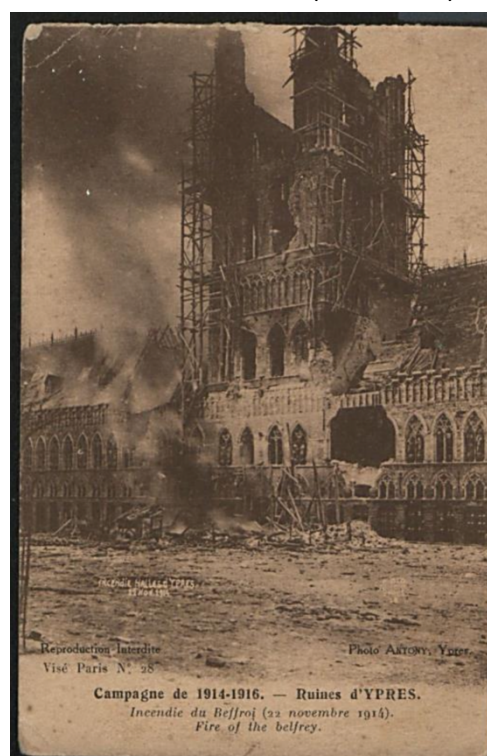
Figuur 1: Anthony, 'Ieper', 22 november 1914 (Stadsarchieef Ieper C15_4416)

In die zin veroorzaken oorlog en gewelddadige conflicten niet alleen menselijke slachtoffers; ook materiële schade aan gebouwen zijn later als symbolische littekens terug te zien in een stad. Tijdens het conflict worden gebouwen die van cultureel, historisch of ideologisch belang zijn bovendien vaak gericht aangevallen. 2 Na afloop van het conflict, en vaak zelfs al tijdens, moet er echter iets worden gedaan met de schade. De behandeling van deze gebouwen, of deze herbouwd worden of er iets anders voor in de plaats komt (of juist bewust bewaard wordt als ruïne) is onderdeel van het herstel van de samenleving na het conflict. Deze gehavende gebouwen worden, voor zover ze dat voor het conflict niet al waren, getransformeerd tot Lieux de Memoires en krijgen zo een nieuwe betekenis. Hierbij kunnen verschillende groepen een ander beeld en een andere visie hebben bij één gebouw. De manier waarop dit wordt aangepakt heeft dan ook meer gevolgen dan alleen de aanblik van het straatbeeld. Verschillende belangen spelen daarbij een rol, waarbij tijdens de wederopbouw het cultureel erfgoed volgens Sultan Barakat niet zelden een ondergesneeuwde plaats krijgt in het proces. 3