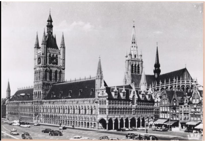
Figuur 16: 'Grote Markt met Lakenhallen en Sint Maartens kerk', 1979-2000

De Lakenhallen in 1905, vóór de verwoestingen van de Eerste Wereldoorlog.