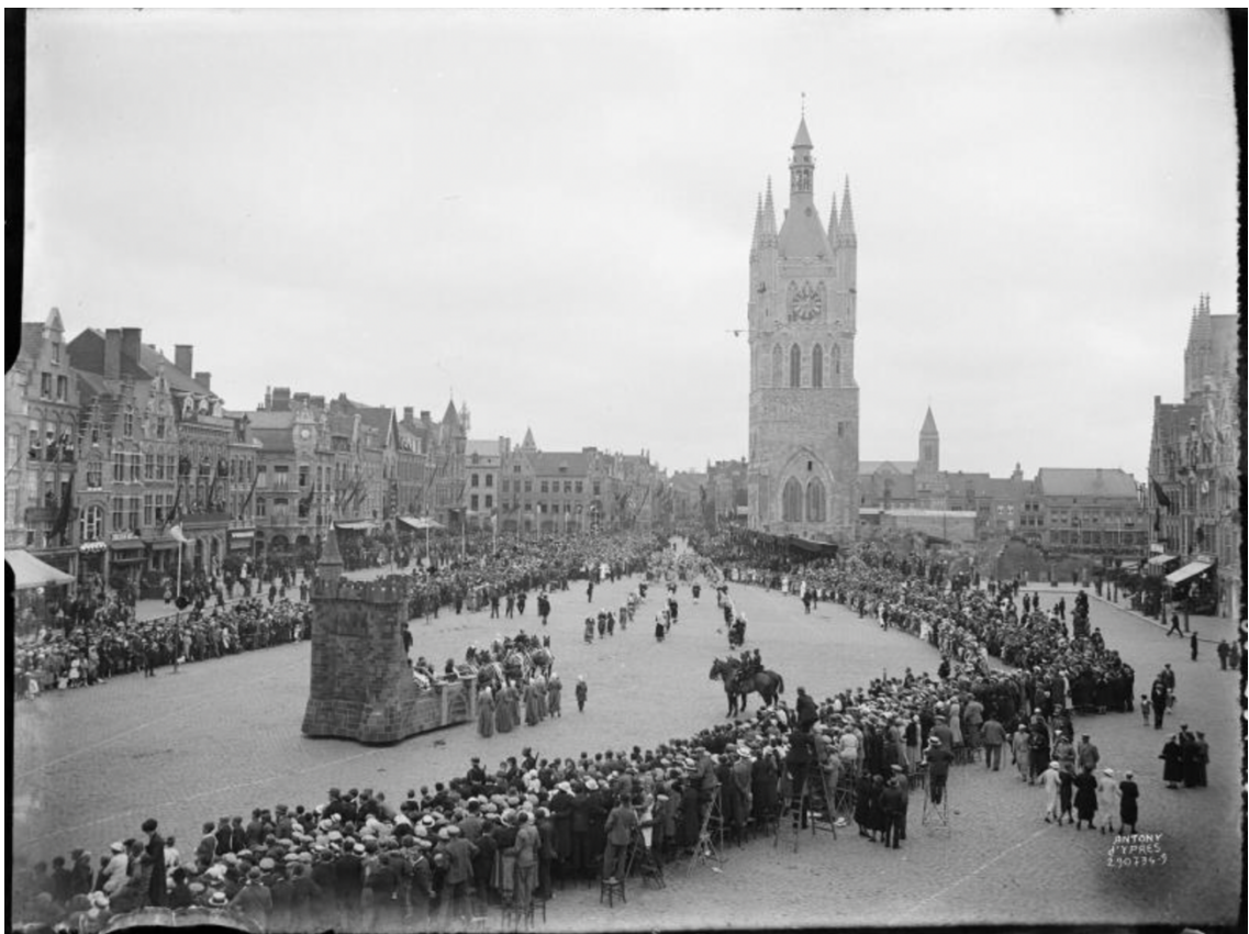
Figuur 10: Maurice Anthony, 'Stoet bij de inhuldiging van het gerestaureerde Belfort in Ieper', 29 augustus 1934

uitgebeeld. Nationale en internationale gasten waren welkom bij de feestelijkheden, maar de organisatie, financiering en andere details van de onthulling zijn lokaal georganiseerd, door de leperlingen maar ook de rest van de Westhoek. Waar inmenging van buitenaf tijdens de wederopbouw nodig was (en wisselend werd geaccepteerd) was het slotstuk van deze werkzaamheden volledig in lokale regie. In 1934 zijn de meeste gebouwen en woonhuizen in Ieper weer terug opgebouwd, en het is dan ook begrijpelijk dat tijdens de toespraken en in de krantenartikelen van een voltooiing van wederopbouw wordt gesproken. Ondanks de moeizame en trage start in de eerste vijf jaar na de oorlog, is in de zestien jaar sinds de wapenstilstand enorm veel opgebouwd in een relatief korte tijd. Toch zijn in 1934 de Lakenhallen zelf nog niet voltooid en ook het gemeentehuis is nog niet klaar. Naar de werkzaamheden, de verschillende opvattingen over deze werkzaamheden en de inhuldigingsceremonies van deze beide gebouwen wordt in het volgende hoofdstuk gekeken.