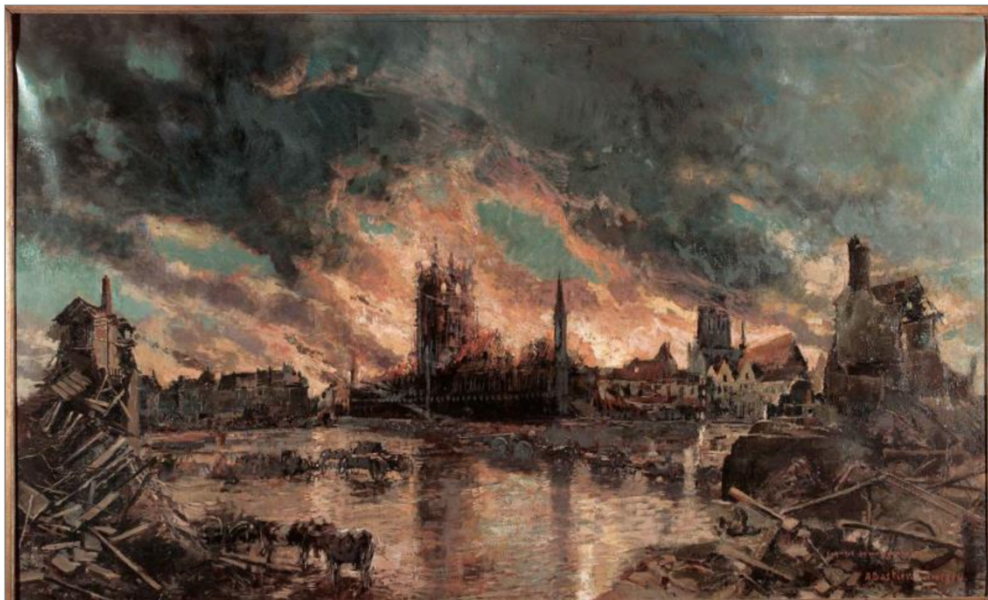
Figuur 2: Alfred Bastien, de brand van Ieper, 22 november 1914 (IFFM)

Op 4 augustus 1914 raakt België betrokken bij de oorlog, en wanneer in de herfst het front vastloopt wordt rond Ieper een saillant opgetrokken die tot tegen het einde van de oorlog bleef bestaan. In die jaren bevindt het front zich wisselend tussen de 11 kilometer tot slechts anderhalve kilometer van de binnenstad vandaan, waarbij er vier 'slagen' plaatsvinden om Ieper.