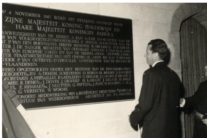
Figuur 15: Antoon Vermast, 'Inhuldiging Stadhuis', 4 november 1967

Omstreeks zes uur kwam het koninklijk paar aan in Ieper en vond er een feestmaaltijd voor genodigden plaats. Om zeven werd naar het stadhuis gewandeld en in aanwezigheid van zowel nationale als internationale ambassadeurs, vertegenwoordigers en politici hield burgemeester Dehem een speech in de ontvangsthal. Na een symbolische inzegening door de bisschop van Brugge, De Smedt, onthulde de koning een gedenkplaat. 152 Hierna werd in de Sint-