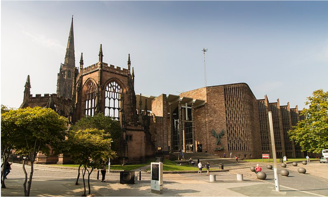
Figuur 18: J. Hannan-Briggs, 'Coventry Cathedral', 14 september 2016 (Wikimedia Commons)

De herbouwde kathedraal van Coventry, met links de bewaarde ruïnes van de vooroorlogse kathedraal.