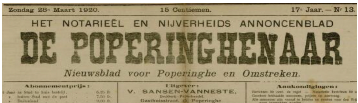
Figuur 19: scan van De Poperinghenaar, 28 maart 1920 (Historischekranten.be)

4. Het behouden van media-aandacht is essentieel, maar deze media mag het wederopbouwbeleid niet dicteren. Ten tijde van het begin van de wederopbouw van Ieper circuleerde vooral kranten met meningen en opvattingen over de wederopbouw, zowel de overzeese geallieerde landen als in Ieper zelf. Het belang van een bekwame redenaar als Colaert komt hier naar voren: zowel kritiek op de plannen van buitenaf (door Engelse belanghebbenden) als lokale kritiek over de traagheid van het proces weet hij in diezelfde pers goed te weerleggen. 175