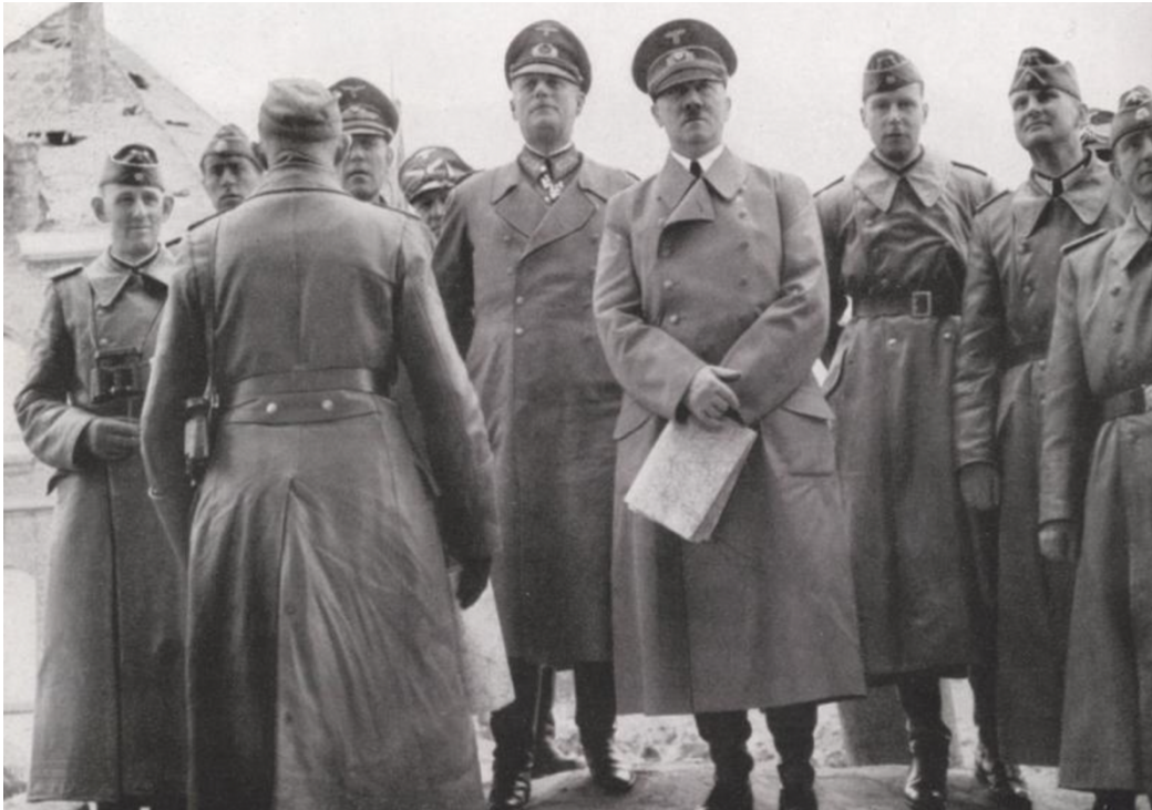
Figuur 12: Heinrich Hoffmann, Frontfahrt Hitlers I. Juni 1940 (Bayersche Staatsbibliothek hoff-30877)

die tijdens de vorige oorlog voor de Duitsers buiten bereik was gebleven, en nu geen tegenstand had kunnen bieden. Het bezoek werd uitgebreid gefotografeerd en gefilmd en gedeeld. 132