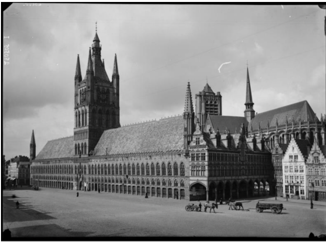
Figuur 17: Maurice Anthony, 'Ypres Halles pris de l'étage chez Mr. Struye' 28 mei 1905 (IFFM IFFCO43_000001)

van de afgelopen decennia. 154 De volharding en het inzicht van de belanghebbende actoren in Ieper, met name Coomans, Colaert en Vanderghote die correct de conflicterende belangen tussen het plaatselijke en nationale bestuur inzagen. De wederopbouw van Iepers belangrijkste monumentale gebouwen bleek er een te zijn van de lange adem, telkens balancerend tussen het verkrijgen van zo veel mogelijk budgetten zonder te veel te vragen, en waar nodig de juiste redeneringen te noemen om zo de nationale actoren ook mee te krijgen. Volgens Dendooven wordt de wederopbouw van de Lakenhallen door velen gezien als 'hét geslaagde voorbeeld van een traditionele/identieke wederopbouw van een icoongebouw na een vernietiging in een industriële oorlog'. 155 In het volgende hoofdstuk wordt de wederopbouw van Ieper en haar traditionele aanpak getoetst aan de theorie van Barakat, en vergeleken met andere, latere wederopbouwprojecten.