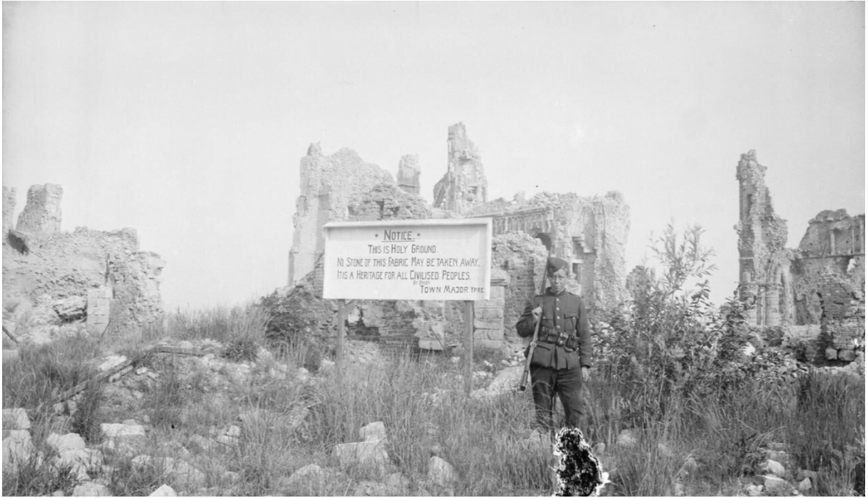
Figuur 4: Ivan Lancelot Bawtree, Notice: This is Holy Ground , (IWM Q 100485)

De stad, waar zo veel (Engelse) soldaten hun leven voor hadden gelaten moest in zijn geheel als ruïne bewaard blijven, om op die manier als zone de silence een Lieux de memoire te zijn waar pelgrims naartoe zouden kunnen trekken, aldus Winston Churchill (tijdens de oorlog Minister of Munitions en na de oorlog Secretary of State of War and Air ) tijdens een vergadering van de Imperial War Graves Commission (tegenwoordig Commonwealth War Graves ) op 21 januari 1919. Engeland zou de ruïnes van Ieper willen verwerven, al dan niet door een gift van de Belgen aan Engeland, dan wel door het kopen van het gebied. 33 Een opvatting die ook door andere inwoners van het commonwealth werd gedeeld: 'She belongs – her halls and churches, her streets and houses, all her people and all her past, henceforth to us, and those who come after us. She is spiritually as much a part of the British Empire as Vancouver or Toronto'. 34 Zelfs koning George V deelde de wens om Ieper als ruïne te behouden. 35 Om de ruïnes heen zouden dan de begraafplaatsen worden aangelegd. Teruggekeerde inwoners zouden buiten de stad een nieuwe stad kunnen heropbouwen. Alfred Mond, first commissioner of Works and Public Buildings , schreef in een brief aan Churchill in februari 1919 dat hij ervan overtuigd was dat de Belgische overheid niet van plan was om Ieper te herbouwen. 36