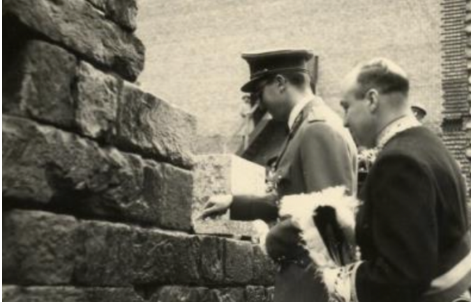
Figuur 14: Antoon Vermast, 'Koning Boudewijn', 17 maart 1957 (Stadsarchief Ieper F09_01100)

Koning Boudewijn plaatst de eerste steen van het Stadhuis