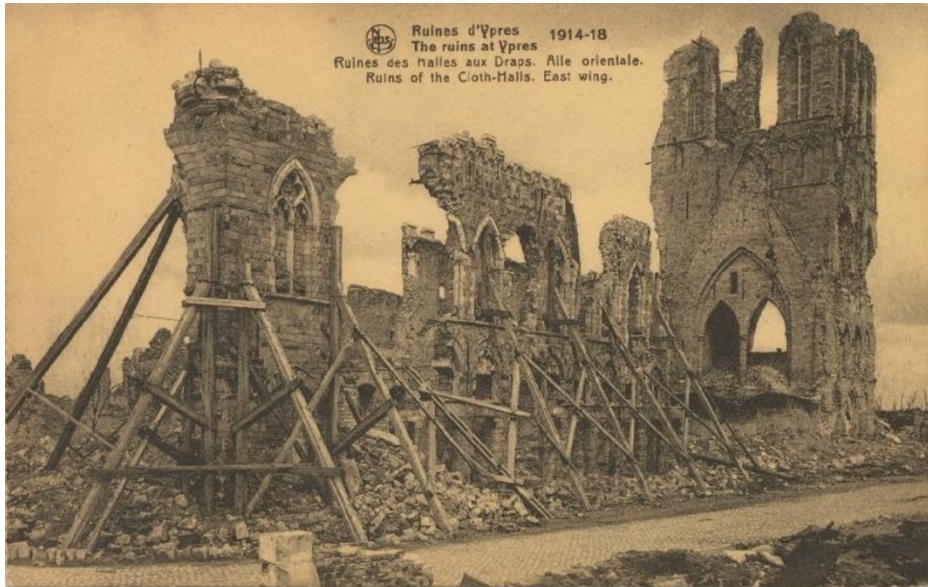
Figuur 3: Ernest Thill, Ruïnes van de Lakenhallen. Oostvleugel (C15_0182 Stadsarchief Ieper)

bezoek, van stukjes steen tot aan flesjes zand, was dat ook in Ieper al het geval: 'by degrees Ypres became a showplace; every soldier required picture postcards of the famous ruins; souvenirs were eagerly acquired, and a small kerbstone industry in shell fuses, stained glass fragments, and relics of all kinds sprang up.' 23