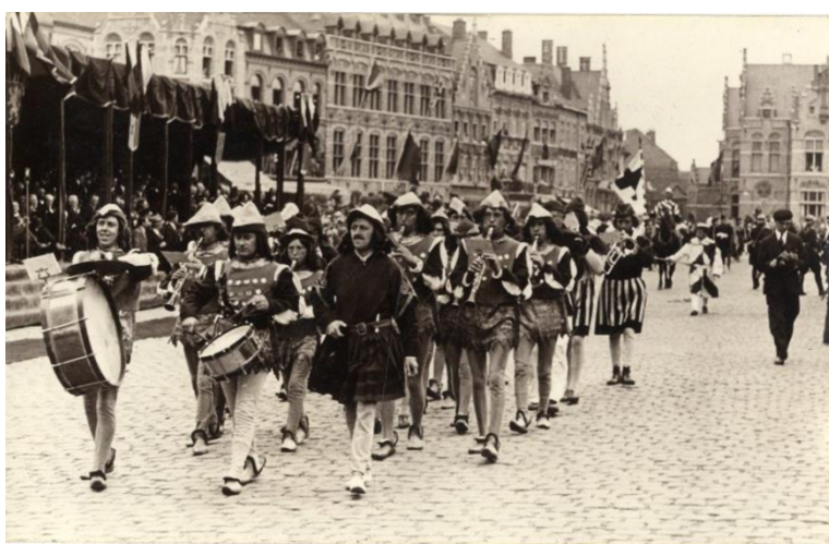
Figuur 9: Dehaeck, Hector, 'Inhuldiging Belfort Leopold III (Stadsarchief Ieper, F34 00067, F34 00055)

De kosten voor de feestelijkheden werden opgehaald door het feestcomité door giften en verkopen van kaartjes voor de feestelijkheden; daarnaast werd ook een erecomité opgericht van dames om een cadeau voor de koningin te kunnen bekostigen. 103 Uiteindelijk zou de koningin niet aanwezig zijn bij de plechtigheid. Genodigden voor de feestelijkheden kwamen verder uit Ieper, maar ook uit Brussel, Antwerpen, Brugge, Gent en enkele Franse steden. Ook was er een groep Britse afgevaardigden aanwezig. Posters voor de feesten werden verspreid in Ieper maar ook verder weg zoals in Antwerpen. 104 Op de aanbesteding van het produceren van deze posters reageerden vooral