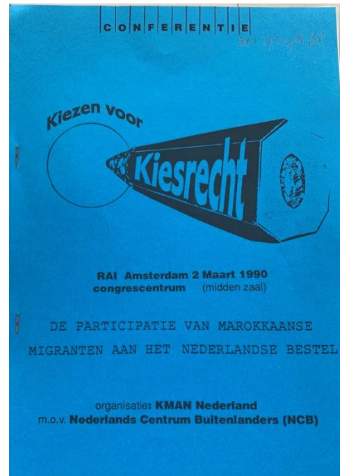
Afbeelding 4. Kiezen voor Kiesrecht -conferentie