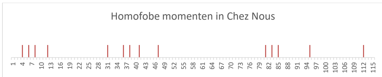
Grafiek 1, Homofobe momenten in Chez Nous

CHEZ NOUS had ook het verhaal kunnen zijn van een vriendengroep zonder homoseksuele personages die hun favoriete kroeg proberen te redden van faillissement. Het einddoel van de film zou hierdoor niet veranderen, maar het zou wel een heel ander verhaal worden, want de seksualiteit van de personages had dan hoogstwaarschijnlijk geen rol gespeeld. Het conflict zou dan van andere elementen dan hun geaardheid komen. De seksualiteit van de hoofdpersonages is dus van belang voor het verloop van het verhaal.