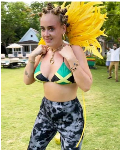
Figuur 2: Adeles Instagrampost

Op 31 augustus 2020 plaatste Adele een foto op Instagram met de beschrijving: “Happy what would be Notting Hill Carnival my beloved London”. 82 Deze foto is te zien in figuur 2. Naar aanleiding van deze foto ontstond er op Twitter ophef met betrekking tot culturele toe-eigening. Er zijn grofweg drie soorten reacties te onderscheiden, namelijk het beamen van culturele toe-eigening, het ontkennen van culturele toe-eigening en niet-gerelateerde reacties aan de discussie.