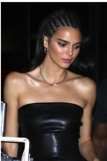
Figuur 4: Kendall Jenner tijdens een avond uit

Eind augustus 2019 droeg Kendall Jenner op meerdere gelegenheden cornrows. Ze plaatste zelf meerdere Instagram stories met dit kapsel en werd er tijdens een avond uit door paparazzi in Los Angeles mee gefotografeerd. 99 Deze foto is te zien in figuur 4. Wederom vielen de uitingen in de casestudy onder andere uiteen in het ontkennen en beamen van culturele toe-eigening.