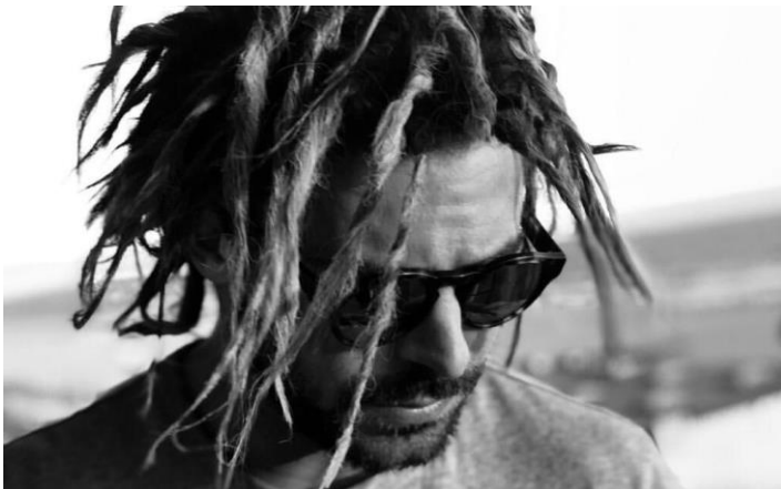
Figuur 3: Zac Efron's Instagrampost

Op 5 juli 2018 plaatste Zac Efron een foto op Instagram met de beschrijving: “Just for fun”. 91 Deze foto is te zien in figuur 3. Net zoals bij de casestudy van Adele vielen de reacties in ieder geval onder te verdelen in het beamen van culturele toe-eigening en het ontkennen van culturele toe-eigening. Opvallend aan deze casestudy was dat de tweets minder veronderstelde machtsrelaties uitdrukten, maar dat de tweets vaker een mening uitdroegen over het kapsel.