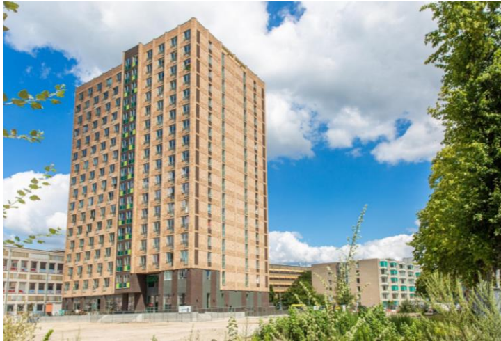
Figuur 4. Mammoet.

Op onderstaande afbeelding is Mammoet, een flat van de SSH verbeeld, waarin juist zelfstandige studio's verhuurd worden waarbij jongeren alle voorzieningen in principe voor zichzelf hebben (SSH, werkafspraken). Bij Mammoet wordt ingespeeld op eerder genoemde fysieke aspecten die ontmoeting kunnen stimuleren. Zo hebben alle studio's een eigen badkamer, toilet en keukentje, maar is er per gang ook een gemeenschappelijke keuken aanwezig om toch interactie tussen bewoners te stimuleren. Dit is overigens niet het geval bij alle zelfstandige wooncomplexen van de SSH. Onzelfstandige studentenhuizen lenen zich dus vaak beter voor het faciliteren van sociaal contact, doordat sociale ontmoeting met huisgenoten onvermijdelijk is. Bij studio's is het niet noodzakelijk om mensen tegen te komen, wat sociale interactie tussen bewoners enigszins kan belemmeren.