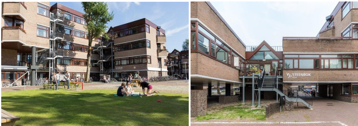
Figuur 2 & 3. De Sterren.

Activiteiten die binnenshuis georganiseerd worden zijn afhankelijk van de woning waarin een jongere terecht komt. In sommige huizen wordt er elke dag samen gegeten en in andere huizen kookt iedereen voor zichzelf. Vaak zijn er gemeenschappelijke afspraken binnen studentenhuizen, met betrekking tot een schoonmaakrooster of coronaregels, doordat faciliteiten dus gedeeld moeten worden.