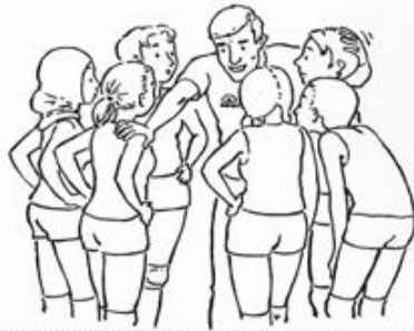
Figuur 1: Casus 1

De sportbegeleider raakt de spelers vaak aan tijdens een time-out.