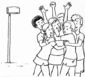
Figuur 2: Casus 2

Een jongen raakt de borsten van een meisje aan tijdens een groepsknuffel.