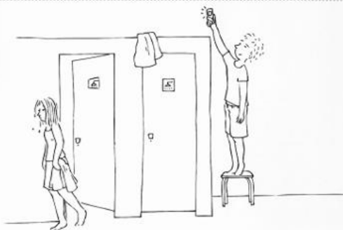
Figuur 3: Casus 3

Een jongen maakt een foto van de meisjes onder de douche en stuurt die naar zijn vrienden.