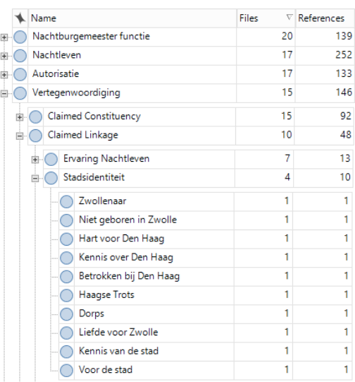
Figuur 4: voorbeeld codeboom

Na het open coderen volgt de tweede fase van de analyse: axiaal coderen. Met axiaal coderen worden de verschillende open codes gecategoriseerd en wordt de data gestructureerd. Deze structuur is op basis van de theoretische modellen die in het theoretisch kader zijn gevormd. Axiaal coderen helpt om verbanden en patronen in de data te ontdekken. Een voorbeeld van een codeboom met betrekking op de claimed linkage is in figuur 4 weergegeven. In de codeboom is duidelijk de structuur van het theoretisch kader terug te zien. Door middel van deze