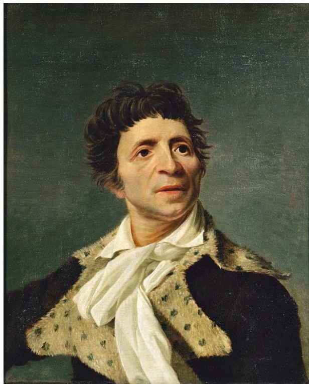
Jean-Paul Marat. (Marat en 1793, Joseph Boze). 128

Toen Marat in 1774 zijn brief aan Wilkes schreef, zal de auteur niet geweten hebben dat hij negentien jaar later zelf de leider zou zijn van een radicale en invloedrijke burgerbeweging onder de armere lagen van de maatschappij. Het moet hem in 1793 vervult hebben met trots over de continuïteit van zijn gedachtegoed en van zijn Britse invloeden. Dat Marat in de revolutie vol bewondering terugkeek naar Wilkes, de ideeën van de Commonwealthmen en zijn eerste politieke publicatie, kan naar aanleiding van deze scriptie wel aangenomen worden. Zijn eerste politieke werk, geïnspireerd op de radicale Engelse politicus en de Commonwealthmen , bleef Marat trouw gebruiken in zijn radicale pogingen om de Fransen te bevrijden van slavernij.