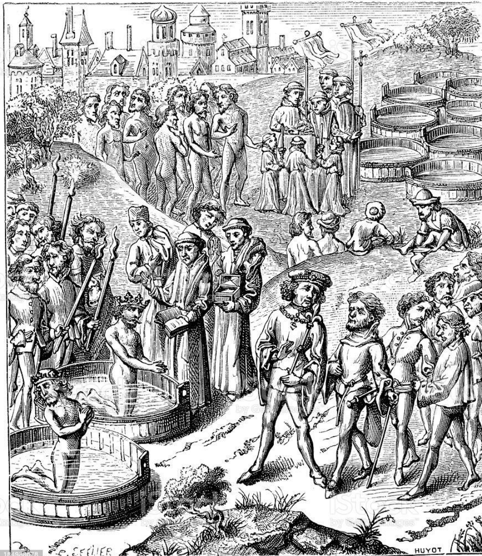
Fig.1 Doop van de Saksen

Een conflictanalyse van de Stellinga-opstand (841-843)