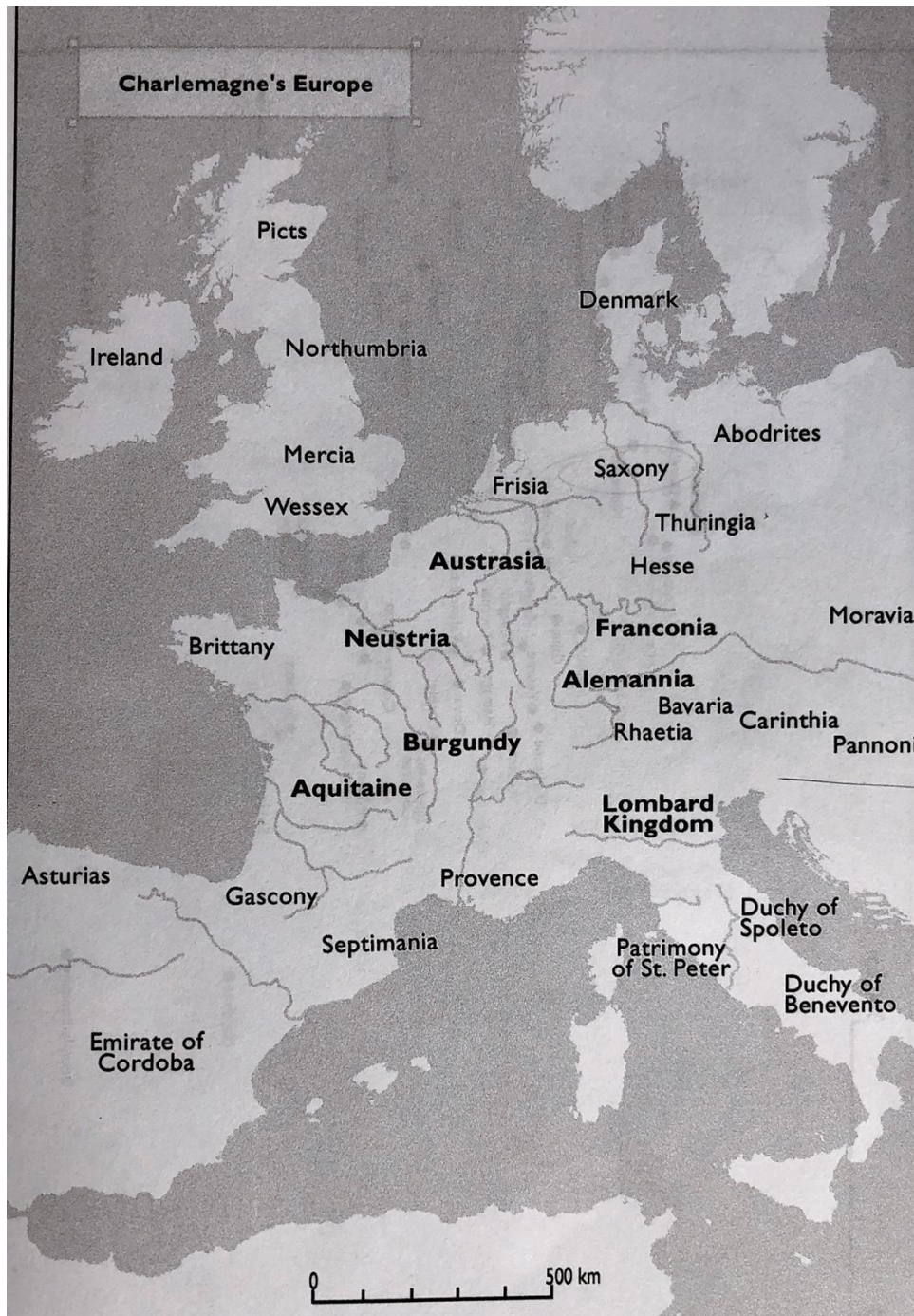
Fig. 2 – Karel de Grote's Europa

If it was a Saxon classification, we can assume there may have been Saxon assembly sites for the region. If on the other hand, this diction has been made by the Franks, the central locations of the regions were more likely of a Frankish nature. 40