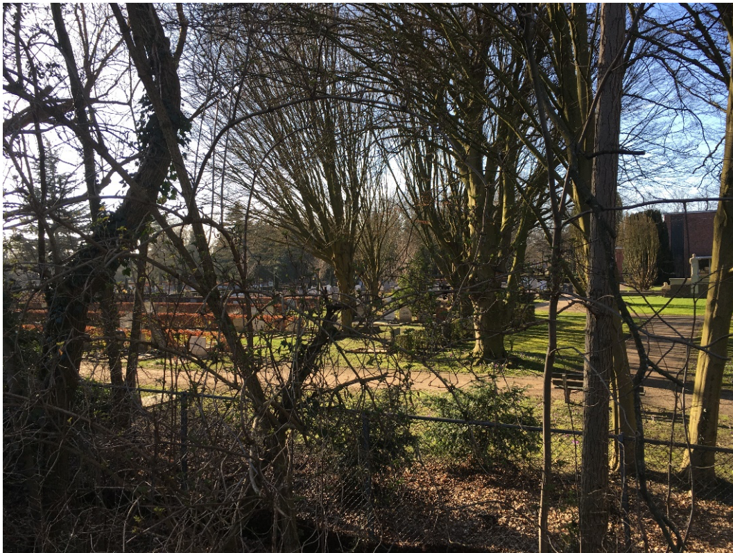
Afbeelding 2. Het uitzicht van de woonwijk op een begraafplaats.