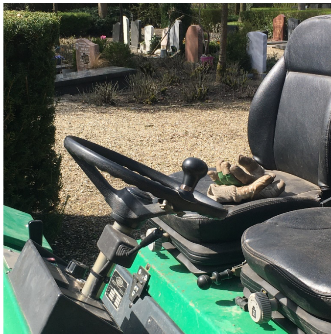
Afbeelding 6.

De menselijke resten die worden gezeefd aan de zeeftafel, komen van het ruimen van een graf. Het ruimen van een graf vindt plaats wanneer de termijn van een graf 11 verstreken is en het graf opnieuw uitgegeven wordt. Het ruimen vindt plaats op een moment wanneer er (weinig tot) geen bezoekers of nabestaanden aanwezig zijn op en rondom de plek van het graf. Meestal is dat in de ochtend vroeg of in de avond wanneer het rustig is. Wanneer er toch bezoekers of nabestaanden aanwezig zijn op de begraafplaats, wordt de plek afgezet met hekken zodat ze het ruimings-tafereel niet kunnen aanschouwen. De openbare ruimte die eigenlijk toegankelijk zou moeten zijn, wordt door de fysieke afscherming van de ruiming ontoegankelijk en non-visueel gemaakt. Het is namelijk niet de bedoeling dat de nabestaanden van de overleden persoon aanwezig zijn bij de ruiming van een graf en het tafereel kunnen zien. Mogelijk om dezelfde reden dat de zeeftafel afgeschermd wordt; bij een praktische handeling in relatie tot het dode lichaam wil/kan men geen persoonlijke emotie ervaren.