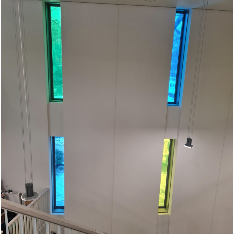
Afbeelding 3. Genomen door medewerkster van de basisschool ter illustratie van het uitzicht op de begraafplaats.

Eenzijds is deze visuele afscherming geplaatst om de kinderen te beschermen tegen de (deels) openbare processen rondom de dood omdat die mogelijk conflicteren met hun wereldbeeld. Anderzijds wordt de begraafplaats afgeschermd om de privacy van de rouwende persoon te waarborgen door direct uitzicht te verminderen. Aan de hand van Madanipour (2005) zouden we kunnen stellen dat de begraafplaats in deze context gezien kan worden als public space terwijl het door de basisschool benaderd wordt als private space . Dit omdat de ruimte van de begraafplaats enkel op uitzondering door de basisschool openbaar en toegankelijk gemaakt wordt voor de kinderen, in een setting waarin de ruimte bewust kan bijdragen aan een educatief doel en op dat moment benaderd wordt als public space (Madanipour, 2005). De directeur van de betreffende begraafplaats die aangrenzend is, heeft mij verteld dat er regelmatig rondleidingen worden gegeven aan scholen en kinderen die in de wijk wonen. Op die manier wordt de ruimte alsnog toegankelijk gemaakt voor kinderen, in een gestructureerde en gelimiteerde vorm vanuit de basisschool.