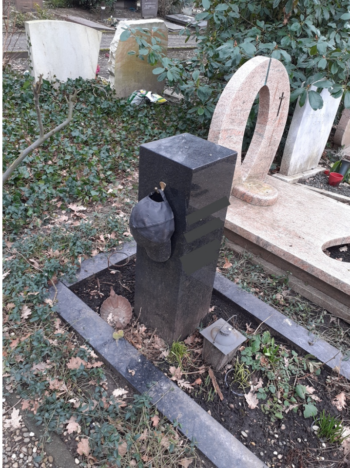
Afbeelding 7. De foto is bewerkt, de tekst op de steen is onleesbaar gemaakt. Dit is gedaan om de privacy te waarborgen.

Wanneer de aanwezigheid van de overledene niet meer wordt getoond in het landschap van de begraafplaats, kan dit ervaren worden als een afwezigheid van de persoon door de nabestaanden. Door een afwezigheid van een monument wordt de afwezigheid van de persoon in het leven van de nabestaanden extra benadrukt. Eén van de families die met grote regelmaat de begraafplaats bezoeken, is de familie de Jong bestaande uit een moeder en volwassen zoon. Tweemaal daags bezoeken zij de begraafplaats om naar het gezamenlijke graf van de vader en zoon te gaan. De vader is enkele maanden terug overleden en is bij de zoon begraven die hier al langer ligt. Nu is de steen naar de steenhouwer om de tekst en de foto op het monument aan te passen, zodat zij beide op de steen staan. Hoewel er nog planten op het graf staan, wordt de afwezigheid van de steen als een leegte ervaren. Tijdens het interview met de familie de Jong, vertelt de moeder: ‘Het is anders. Ja.. Het is een lege plek, en dat doet denken aan de leegte in het leven. Dan is het maar kaal als je