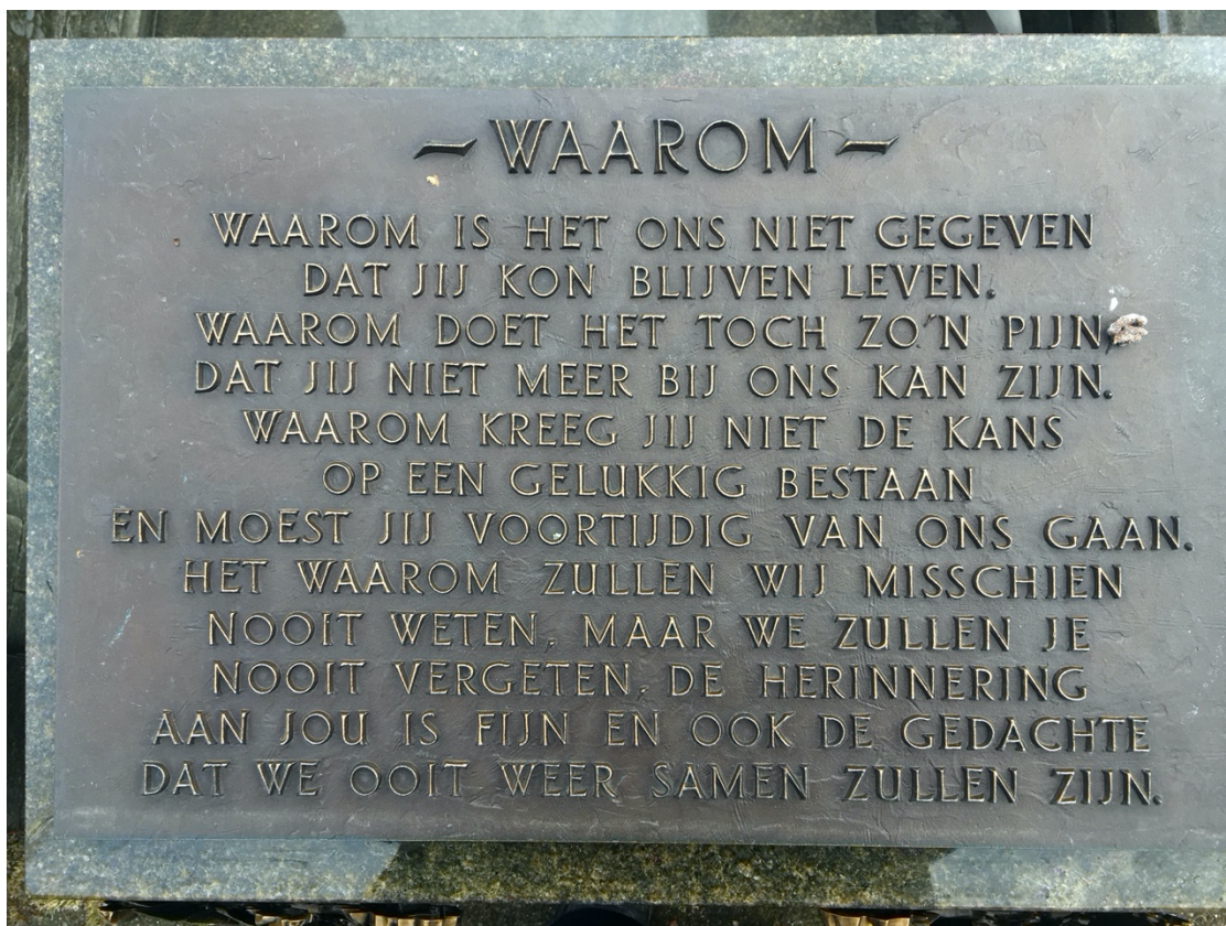
Afbeelding 4. Genomen door Eva Lakwijk, tekst op een van de particuliere graven.

uitvaartstoet die door de wijk trekt. Deze elementen zijn zodanig opgenomen in de dynamiek van de buurt dat het voor omwonenden en omwerkenden bijna vanzelfsprekend voelt, maar zorgt ook voor enig bewustzijn dat er iemand “heen is gegaan”. Het zorgt dus voor een realisatie dat de dood bestaat, maar het lijkt ook alsof het een bijna een vanzelfsprekend fenomeen is voor de omwonenden en omwerkenden van de begraafplaats. De confrontatie met de dood door deze visuele elementen in de openbare ruimte van het stedelijke gebied zorgen dus niet elke keer voor het idee dat de dood iets vervelend is omdat het op een bepaalde manier onderdeel is geworden van het dagelijkse leven. Door het gebruik van deze openbare visuele elementen wordt de samenleving betrokken bij de gebeurtenis van het overlijden van een persoon. Dit zorgt voor een moment van stilstaan en verbinding in de wijk op die momenten (Venbrux et al. 2009; Metcalf en Huntington 1991). Het zien van een rouwauto in de buurt of een uitvaartstoet in de openbare ruimte en de erkenning van buurtgenoten en stadsgenoten creëert een breder draagvlak (Venbrux et al. 2009, 99). Door de erkenning en steun kan de rouw en het verdriet beter verdragen worden.