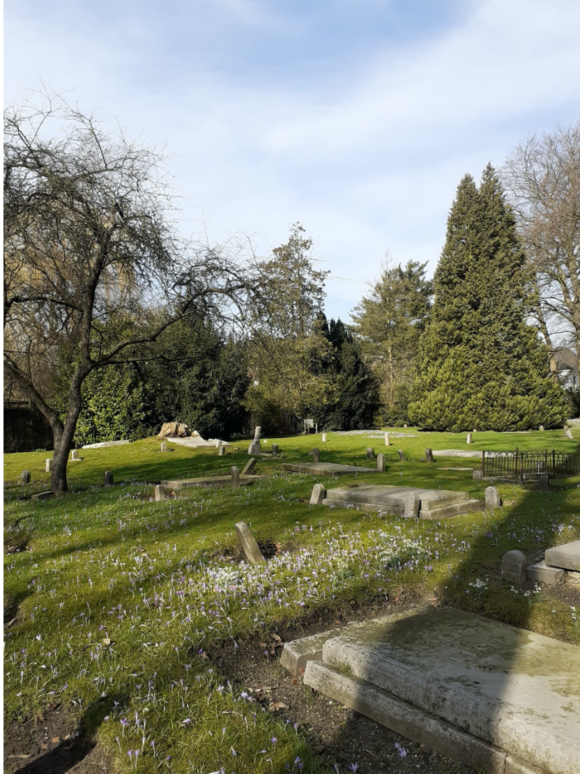
(Afbeelding 10, grafstenen met Belgisch natuursteen op gemeentelijke begraafplaats Soestbergen in Utrecht 33 )