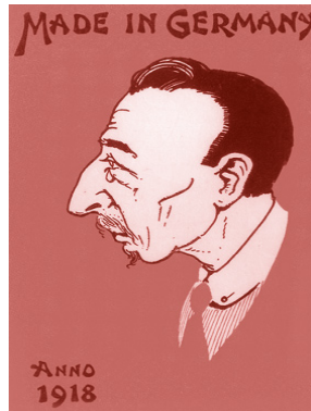
Afbeelding 3.1, J.S. Wijne, De vergissing van Troelstra. 39

doden als gevolg. 38 Hierna was het momentum volledig uitgedoofd en werd er toen al gesproken van de vergissing van Troelstra, zoals te zien valt in de spotprent hieronder.