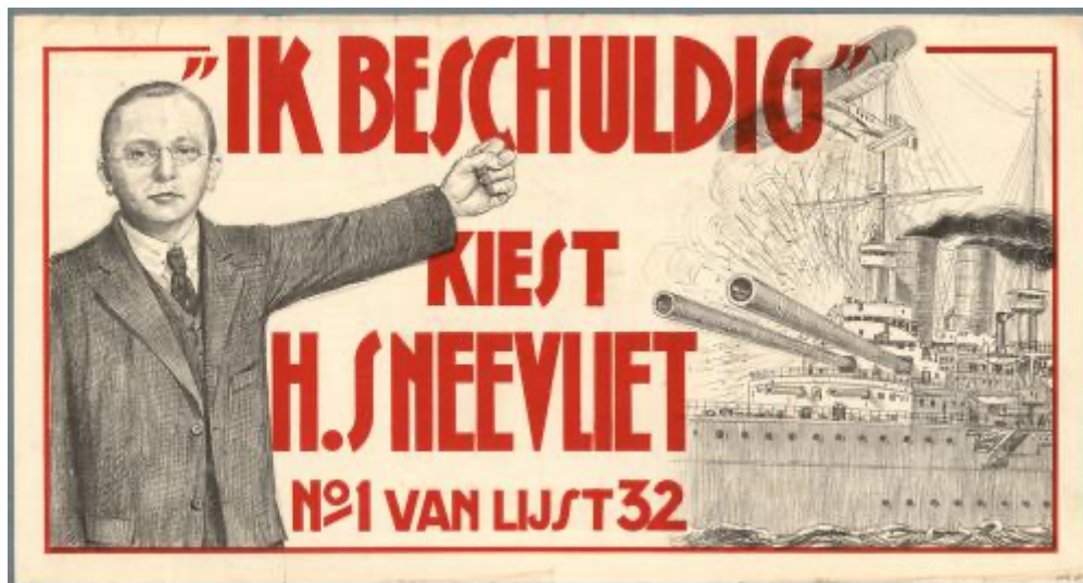
Afbeelding 3.2, Verkiezingsaffiche van de RSP, 1933. 49

De genomen maatregelen waren veel ingrijpender dan de rode week van 1918. Naar aanleiding van de rode week in 1918 reageerde de toenmalige regering juist verzoenend, terwijl we na de munitie juist het tegenovergestelde zien. De regering nam meer ingrijpende maatregelen tegen links Nederland. Juist omdat de regering een bredere associatie had met munitie en linksradicalisme. Vanwege de ervaringen met de Rode week van 1918 en de internationale context van munitie die voornamelijk links georiënteerd waren.