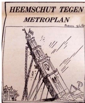
Afbeelding 2: Heemschut tegen Metroplan

Als het gaat om wat erfgoed is, conformeerden zich de tegenstanders van de gemeentepannen aan het erfgoeddiscours van de gemeente. Monumenten waren gebouwen, die door de gemeente officieel beschermd werden en dus aan de gemeentelijke voorwaarden voldeden. De actiegroep schetste bijvoorbeeld de geschiedenis van de Lutherse Kerk en het restauratieprogramma dat in samenwerking met de gemeente – of beter gezegd Stadsherstel - en het Hotel Sonesta werd