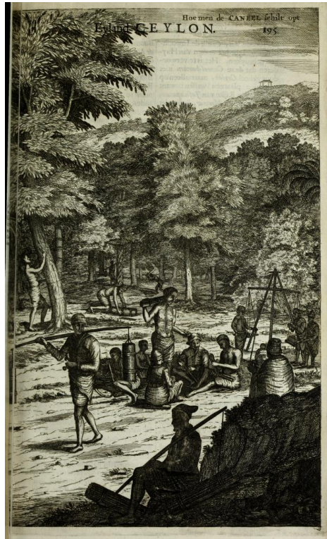
Kaneelschillers aan het werk voor de VOC in kaneelbossen op Sir Lanka volgens dominee Baldaeus, 1672 1