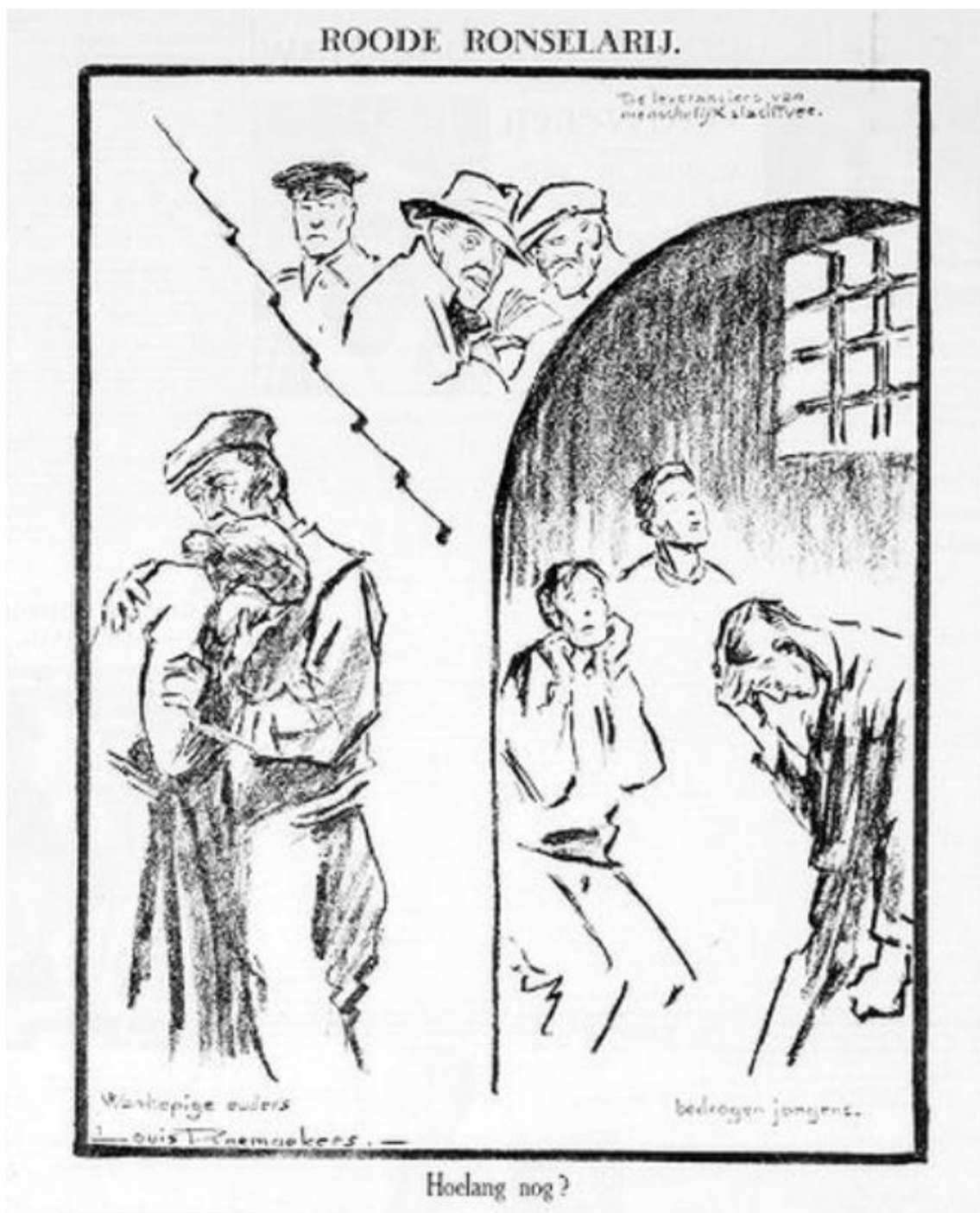
Figuur 2: Prent uit de Telegraaf, toont (kloksgewijs) 'De leveranciers van menscheijk slachtvee', 'Bedrogen jongens' en 'Wanhopige ouders'. 39