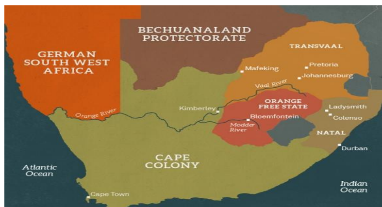
Figuur 1: De Boeren belegerden op meerdere fronten tegelijk strategische steden en werden pas in februari teruggedrongen.

Het leiderschap werd in januari 1900 overgenomen door de ervaren generaal Lord Roberts, er kwamen tienduizenden versterkingen en de Britten veranderden hun tactiek: de klassieke, frontale offensieven die de zelfverzekerde Britten zo vaak succes hadden bezorgd in hun koloniale oorlogen, werden vervangen door flanker manoeuvres en omtrekkende bewegingen. Vanaf 15 tot en met 28 februari werden alle drie de belegerde steden door de Engelsen ontzet en gaven twee grote Boerenlegers met 4,000 man zich over. Het ontzet van Ladysmith op 28 februari markeert het eindpunt van de conventionele fase. 45